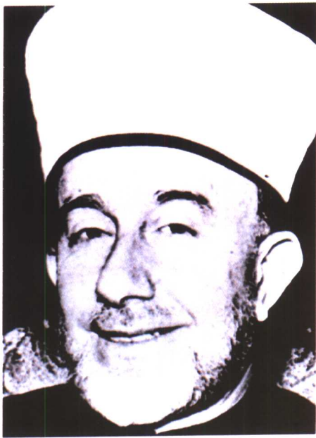
1946 年的哈吉 阿明·侯塞尼