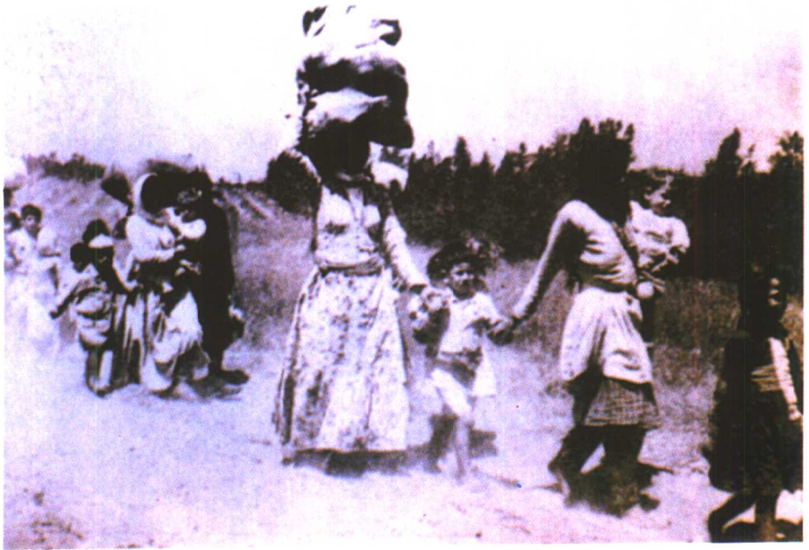
1948 年夏，第一次中东战争爆发后，巴勒斯坦 的阿拉伯人纷纷逃离以色列占领区