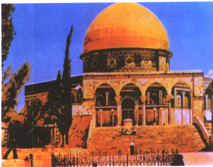
耶路撒冷艾格萨清真寺