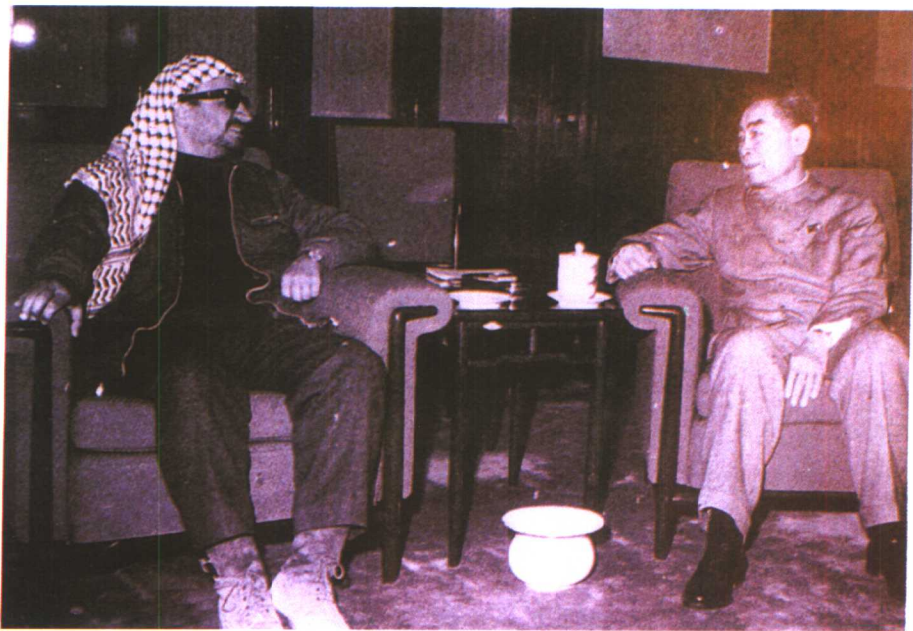
1970年3月周恩来总理会见访华的巴解组织执委会主席阿拉法特