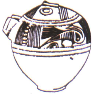
带有天鹅图案的腓力斯人陶罐