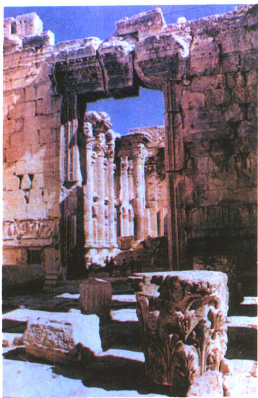
奈伯特王国首都皮特拉城遗址 (公元前2世纪)