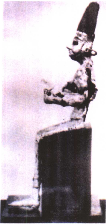
迦南人的巴力神神像 (公元前 13 世纪)