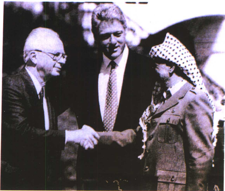
以色列总理拉宾和巴解主席阿拉法特，在和平协议签署后握手