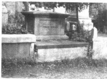
伦敦海德公园斯宾塞墓地