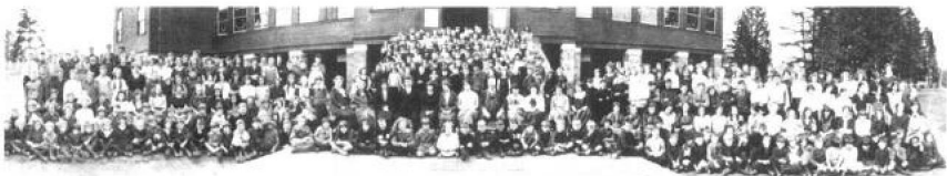
人才辈出，驰名世界的斯宾塞学校