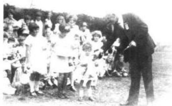
斯宾塞与孩子们在女王公园