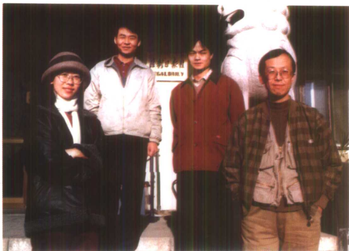
《法制论坛》主要编辑记者