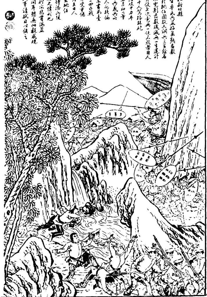
何元俊繪：見點石齋畫報