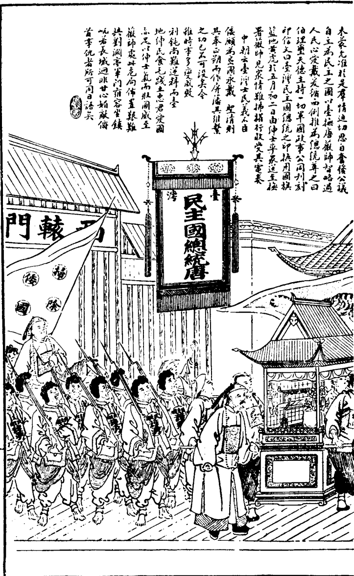
海外扶餘 1895年(光緒 21年)