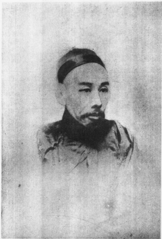
黃 遵 憲 像