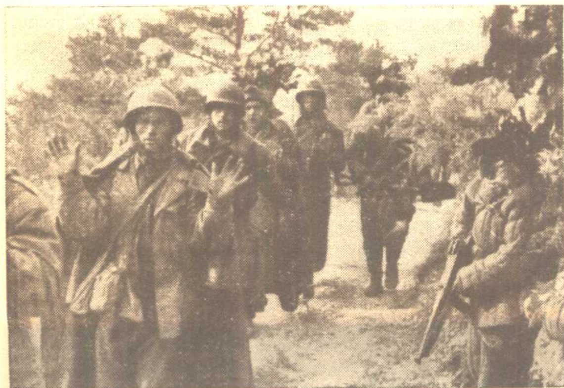
美軍俘虜惶悚地舉着雙手。