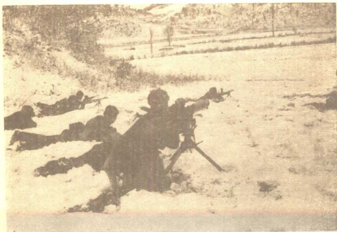
我志願軍在重機槍掩護下，爬冰臥雪，在零下二十度的酷寒中匍匐前進，向敵軍進擊。