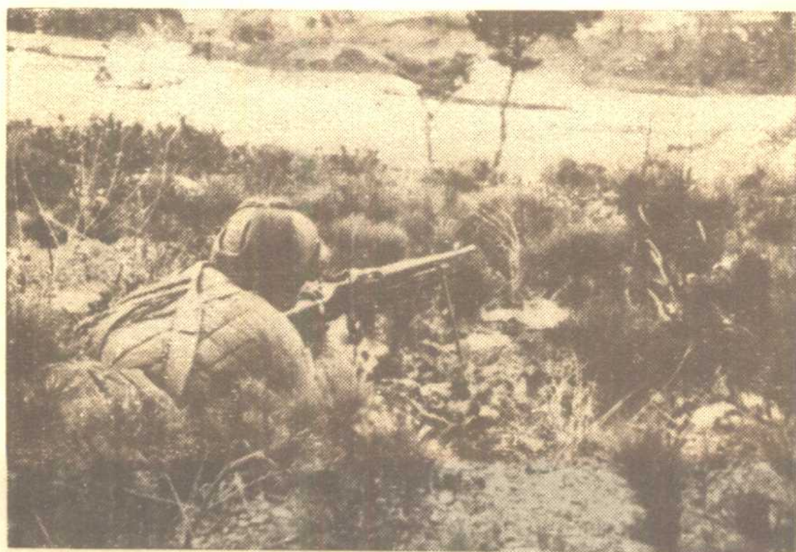
我志願軍機槍手沉着地射擊敵人。