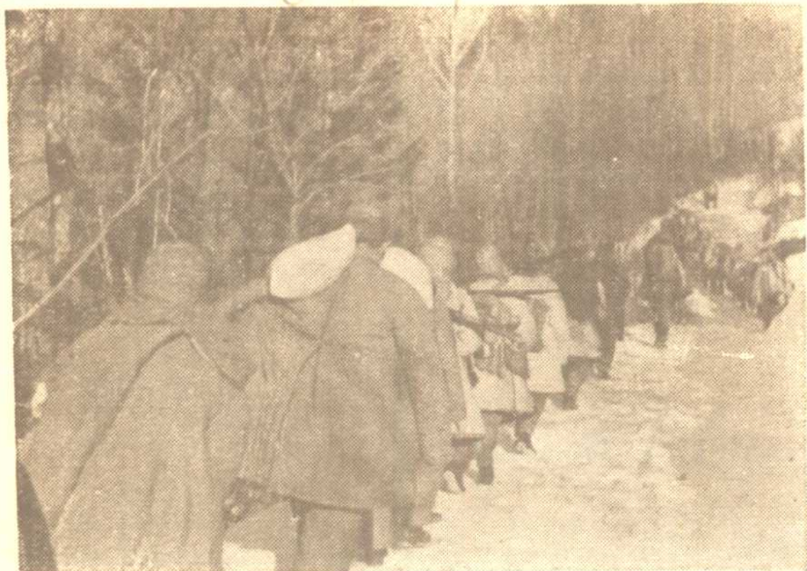
東線我志願軍跨越1700公尺高的雪寒嶺，向長津湖戰場奔馳。