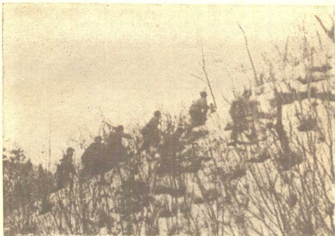
東線柳潭里戰鬥中，我志願軍乘敵不意，踏着深厚的積雪，通過密密的荊叢，向敵人猛攻。