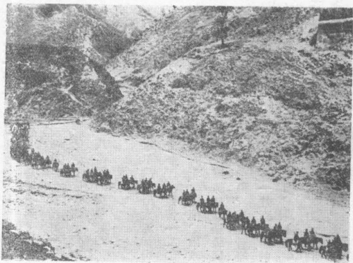
——五師騎兵部隊開進晉察冀邊區。

造。由於八路軍在敵後英勇奮戰，使得日寇兵力分散，給養不足，國民黨的一、二十萬大軍才能聚守忻口，勉強支持了二十八天。