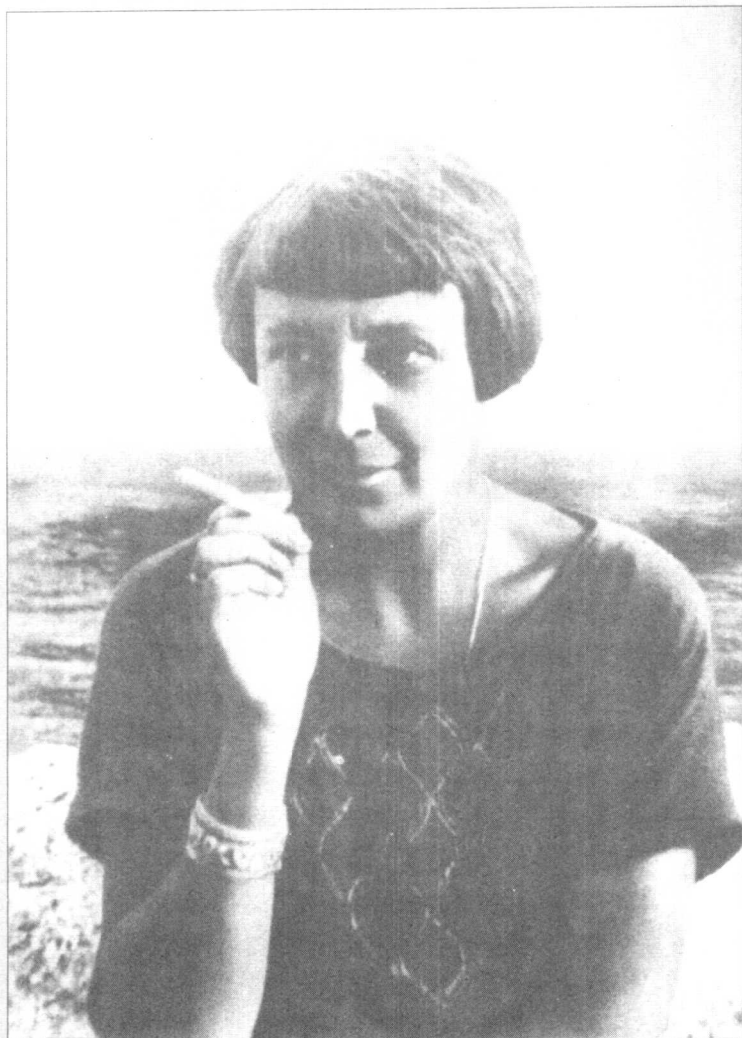
1930年 巴黎 玛·茨维塔耶娃