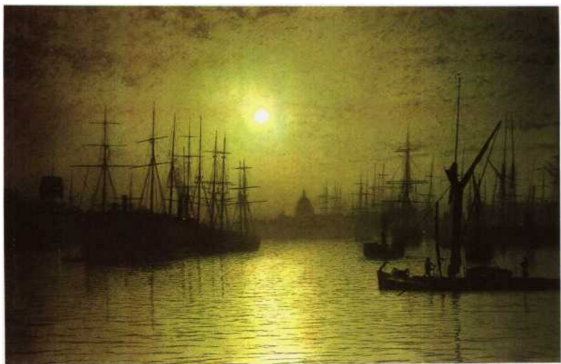
4. 格里姆肖《夜幕降临泰晤士河》

是无意思的，因为我们根本不能回答这类问题，我们只能说它们的荒唐无稽。哲学家们的大多数问题和命题是由于我们不理解我们语言的逻辑而来的。”(参阅维特根斯坦《逻辑哲学论》，第44页，北京，商务印书馆)所以，维特根斯坦认为，把美学看成是说明美是什么的科学，便是“可笑的”《关于美学、心理学和宗教的议论和谈话》，11，1，并参看维：“美的概念已带来一大堆灾难……”；“奇怪的是，许多时代都不能把自己从‘美’和‘美的’概念中解脱出来”(《文化价值》1946, 1948)等等。审美和伦理都属于非定义的领域。比兹利(M. C. Beardsley)等人的分析美学在这个哲学潮流中便也风行一时。