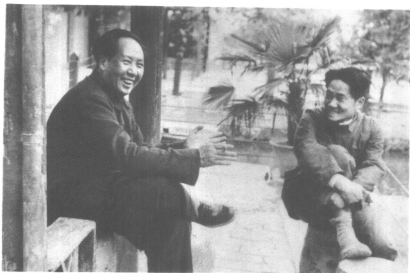
毛泽东与毛岸英在 一起（一九四九年）