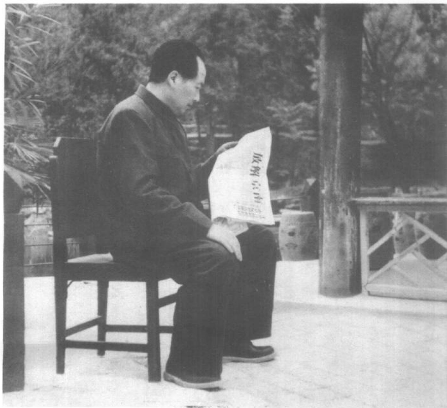
一九四九年，毛泽东在双清别墅看 解放南京的胜利捷报。