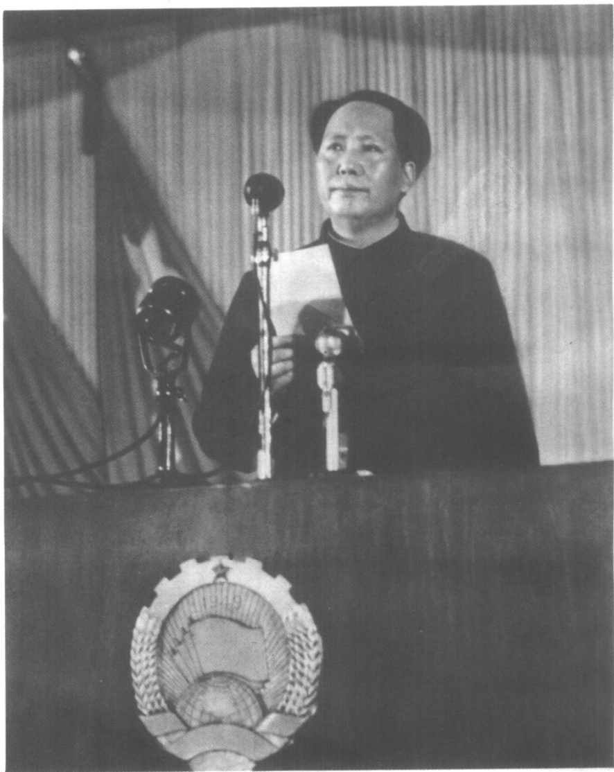
一九四九年九月，在中国人民政治协商会议上，毛泽东当选为中华人民共和国中央人民政府主席。