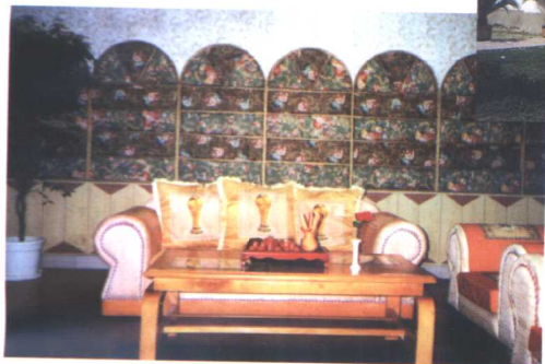
▲南昌自在轩茶艺馆