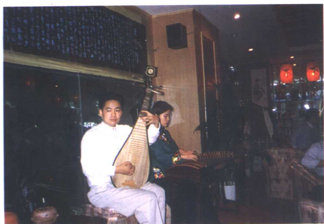
◀ 广州闲云居茶艺馆一角