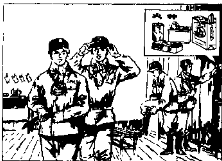
图 2-2 穿戴整齐排队下井

进出罐笼、上下车，服从指挥要自觉。 罐、车之内守纪律，不许打闹和拥挤。 乘人车，且莫站，不准用手扒车沿。 斜巷行车不行人，声光信号要留神。 皮带、溜子不能坐，严禁爬、蹬和跳车 来往车辆看仔细，跨越轨道要注意。