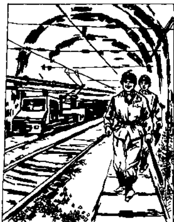
图 2-4 大巷行走