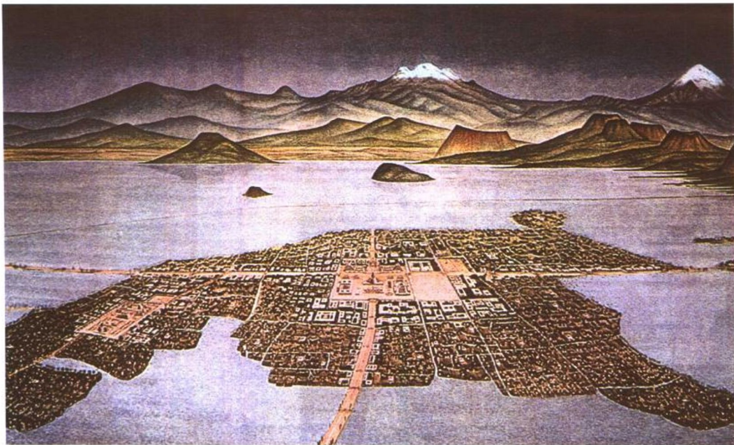
左图：描写13世纪时之特诺契提兰岛和墨西哥河谷的壁画（现在墨西哥城所在地）

威胁的远远大于他本人的工作，或整个景观建筑专业：他懂得了公共活动场地对发展中城市是十分重要的。 “在像墨西哥或其他拉丁美洲国家，那里隔夜之间就可能长出一个新城市的迅速发展变化前提下，有设计的公共活动场地所展示的永久性和坚定的信念，会给城市带来方向感和创造一种形象，一种对未来的展望。城市活动空间——虚的因素——并不是建筑后剩余下来的空白，而是城市空间的重要构成因素，它的形象和它存在的自我意识。”不论其状况如何，这些公园是希望和坚定信念的标志：尽管它们有时看上去有点衰败，它们是合理设计的产物，是可以复原的。与此同时它们为一个人口爆炸中的大都会提供了组织空间的积极因素。