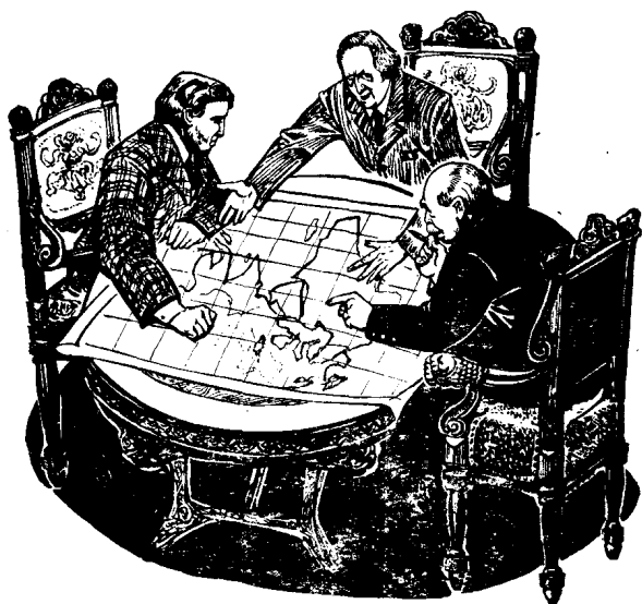
操纵巴黎和会的三巨头