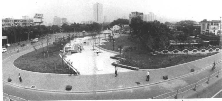
水西门东广场全貌