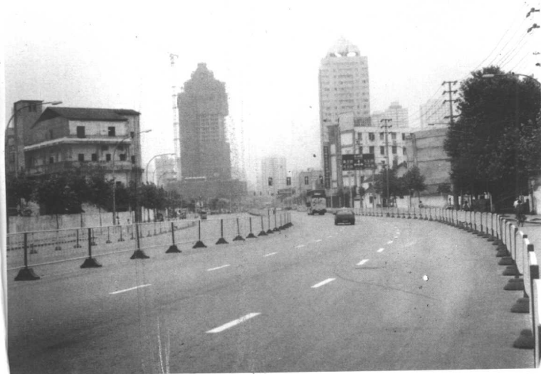
钓鱼台街道地区道路新貌