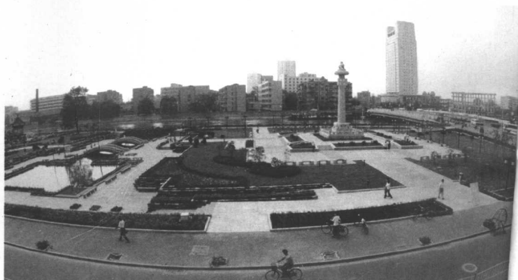
水西門西廣場全貌