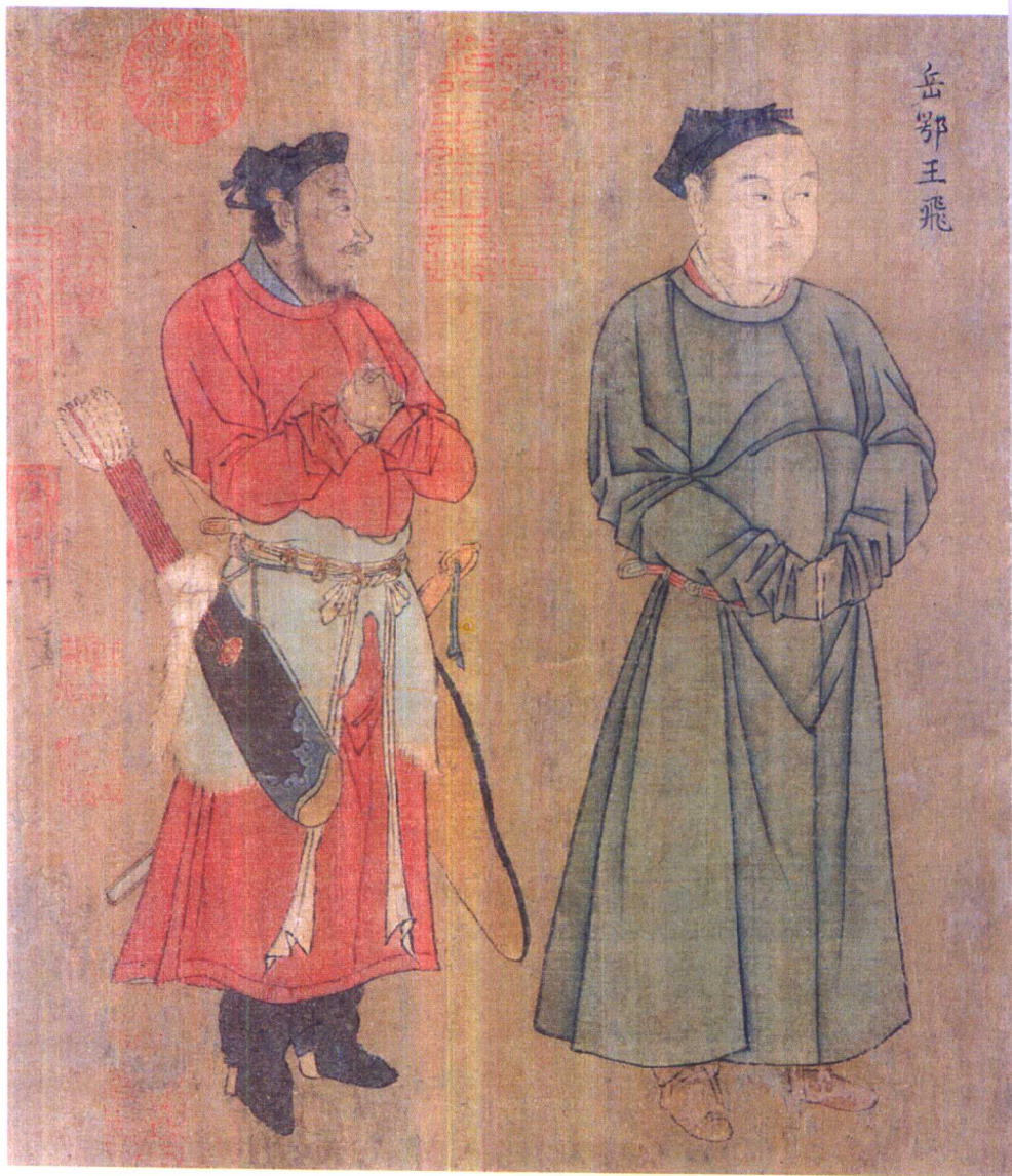
「岳飞像」，本书描写的岳飞形象即据此图。