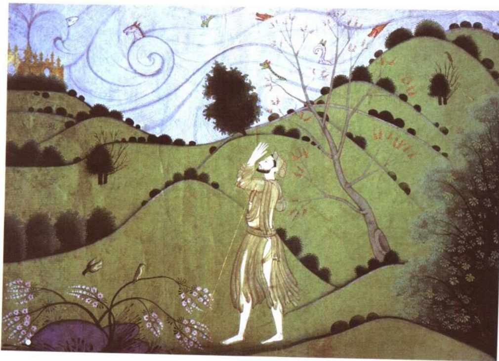
印度细密画 (拍摄于英国大英博物馆) 图 7

在气势辉煌、精美绝伦的艺术品中缓缓散步用心浏览之时，我常常会产生一种奇妙的感觉，即感觉到——不是我在看它们，而是它们在看我。过去现在将来，他们就是这样沉默无言地看着我们一代代人在眼前走过。