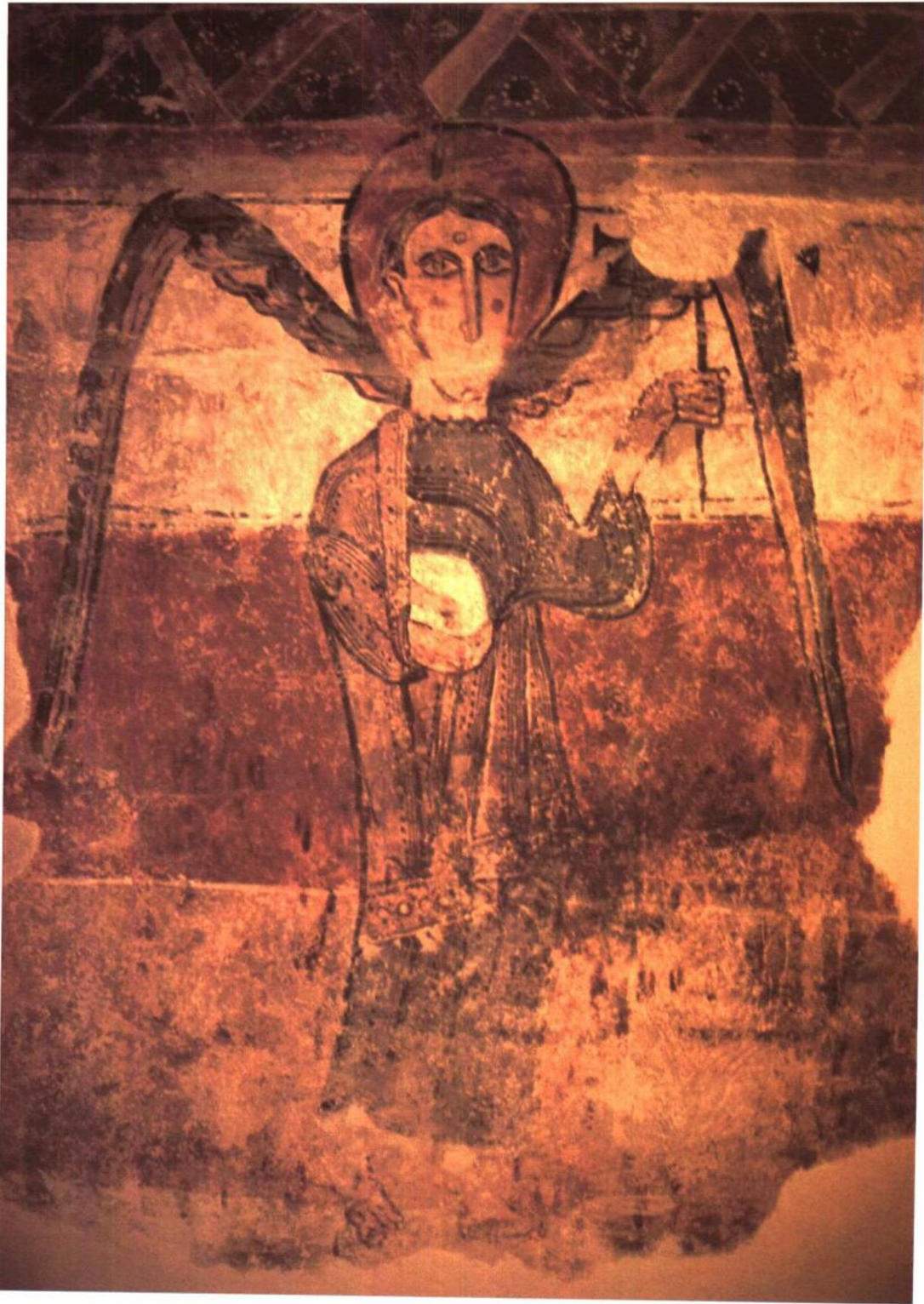
中世纪壁画（拍摄于西班牙加泰隆艺术博物馆）图3

即使在欧洲数量极多的乡村教堂中，也有许多质朴率真的大幅壁画，粗大的黑线，斑驳地勾勒着长着翅膀拿着圣经的天使们，土红，土黄，土绿，土白，平铺成韵，浑厚地演奏着中世纪的圣歌…… 每每看到这些，我都忍不住惊呼——这不都是岩彩吗？！