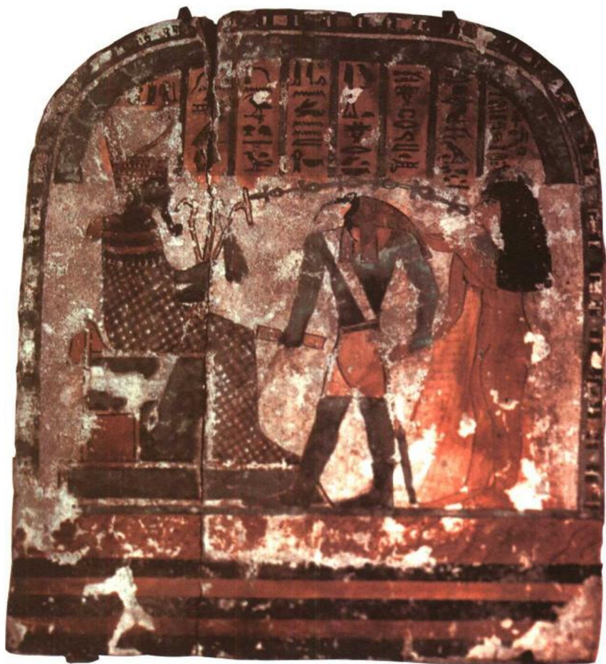
埃及墓室壁画（拍摄于法国巴黎罗浮尔宫）图2