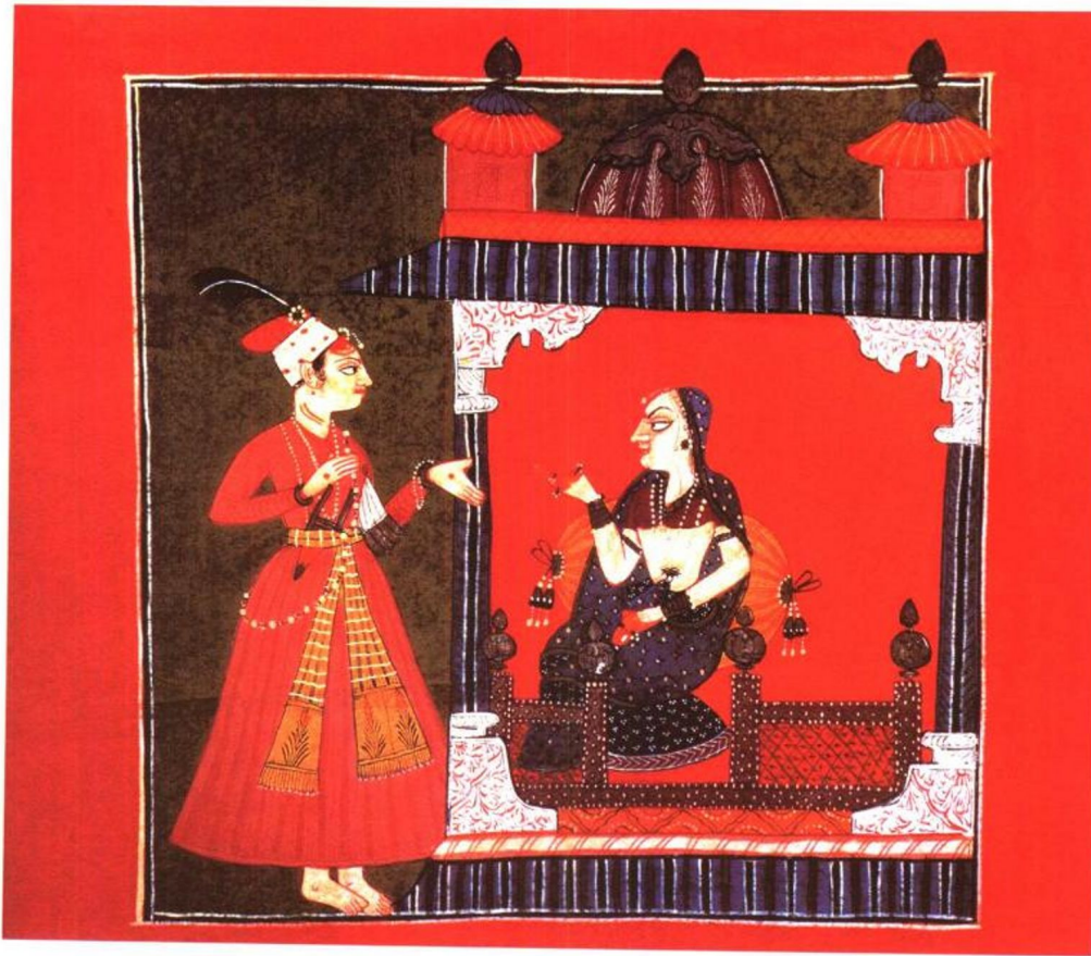
印度细密画 (拍摄于英国大英博物馆) 图 6