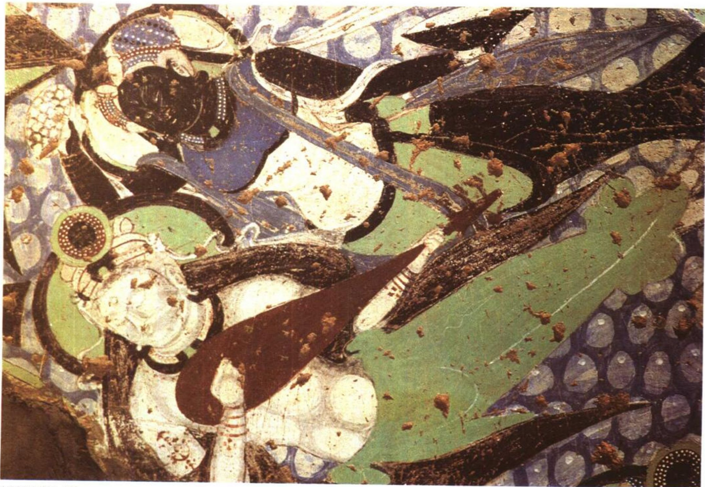
克孜尔石窟壁画 图8

旅行，使我从日常的无奈繁忙中走出，有时间静静地思索；旅行，使我远离尘世的浮躁与喧哗，觉悟到曾深深困惑过自己的那些争论是多么无意义。