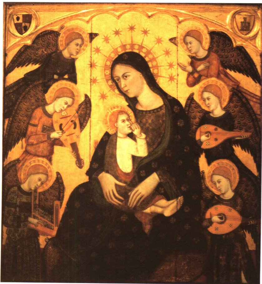
中世纪圣像画 (拍摄于法国巴黎中世纪美术馆) 图5