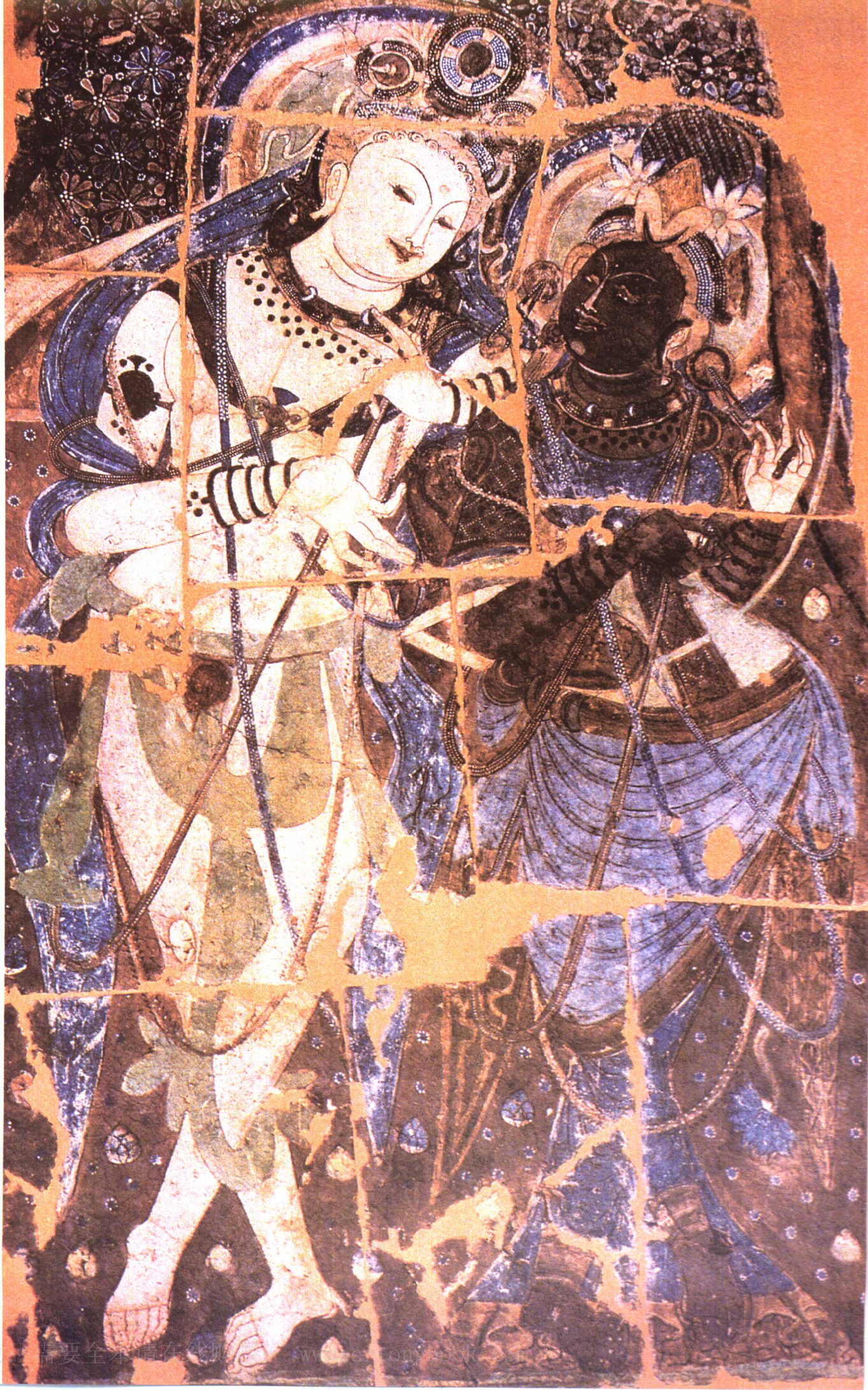
克孜尔石窟壁画 图9