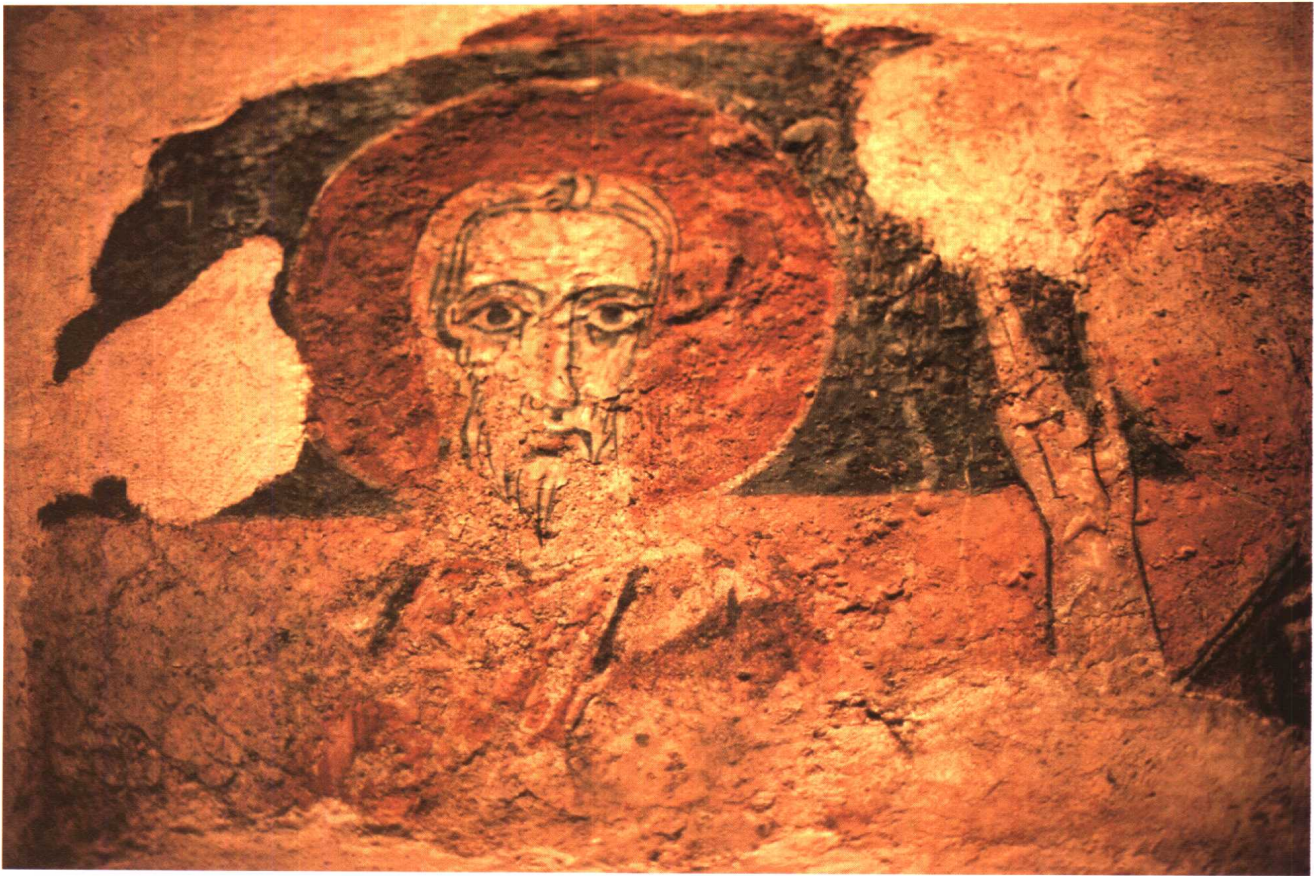
中世纪圣像画西班牙加泰隆艺术博物馆 图4