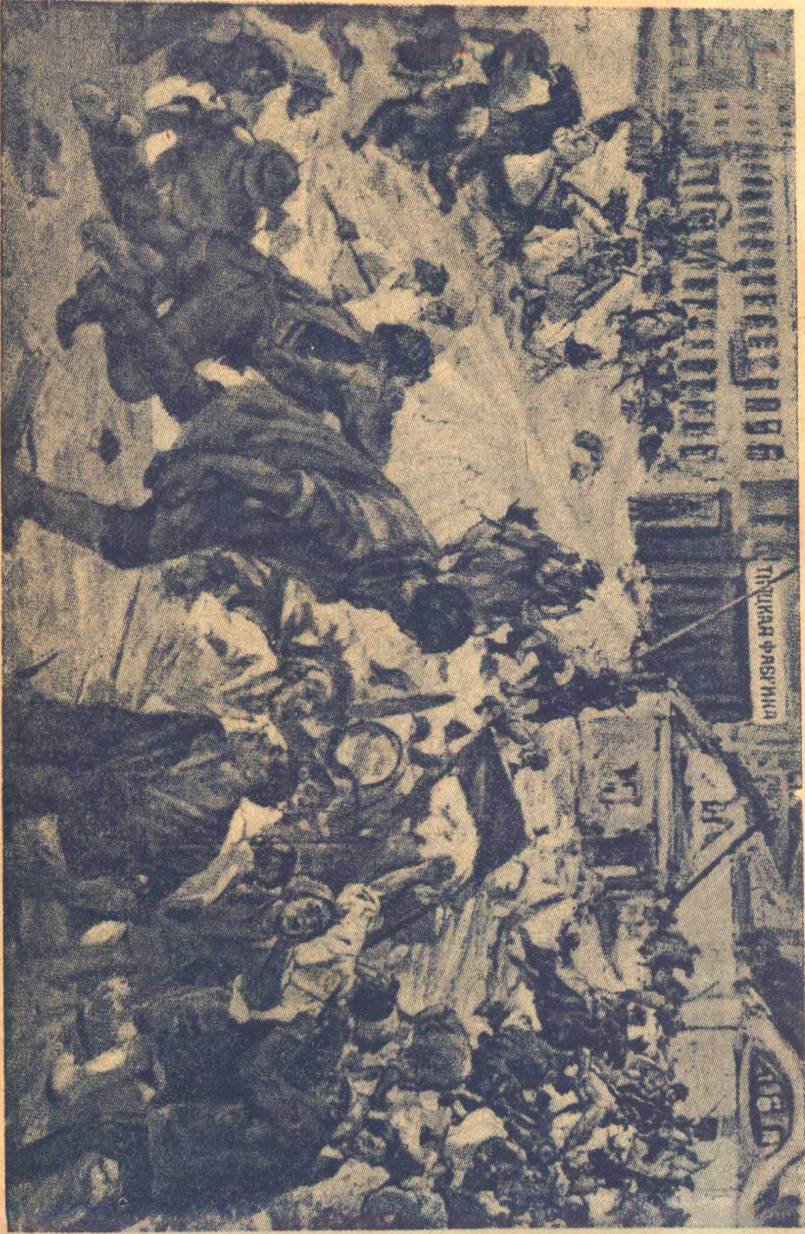
工 罷 特 羅 斯 多 夫 繪