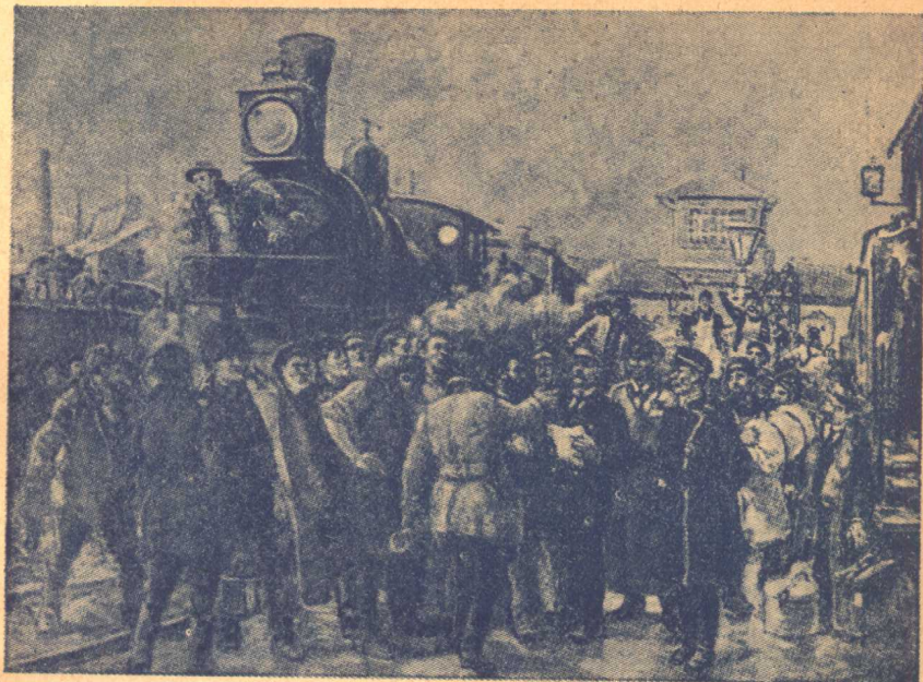
一九〇五年全俄罷工