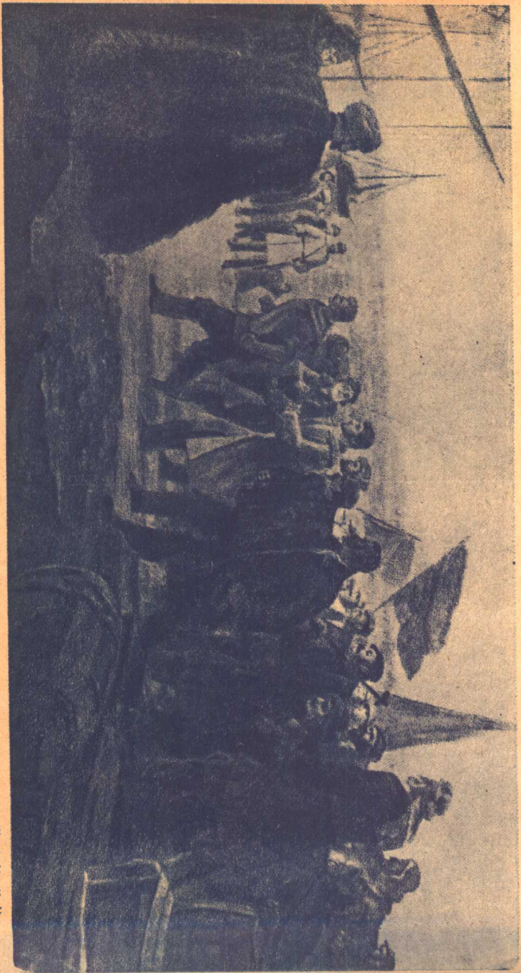
一九〇二年三月九日斯大林同志領導的巴士姆工人示威遊行