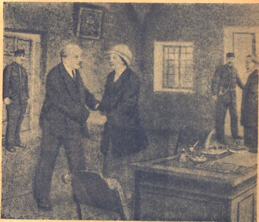
列寧夫人克魯普斯喀亞在諾 維塔爾格監獄典獄室內會晤