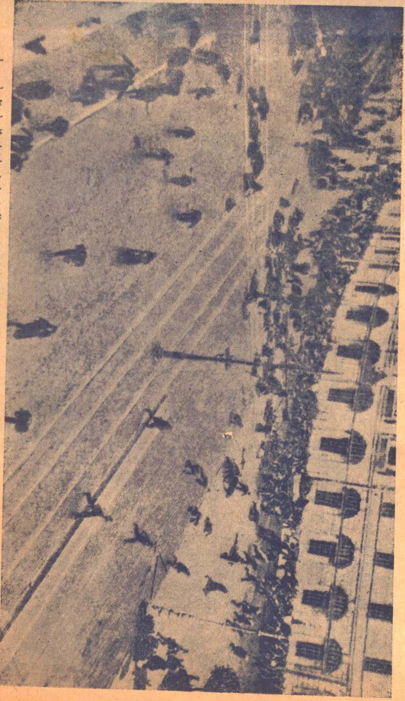
一九一七年七月臨時政府在彼得格勒槍殺示威者