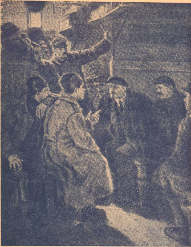
一九一七年列寧在彼得格勒途中