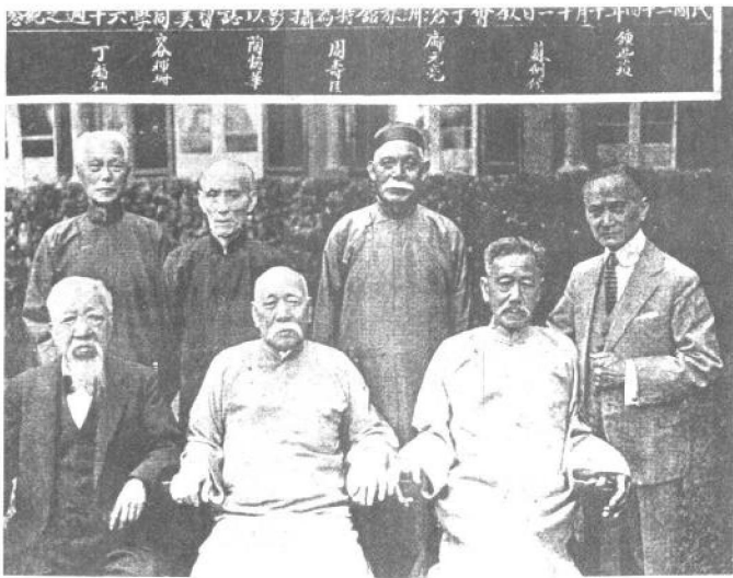
民國二十四年（1935年）部分留美幼童攝于上海，以志留美同學六十周年之紀念。