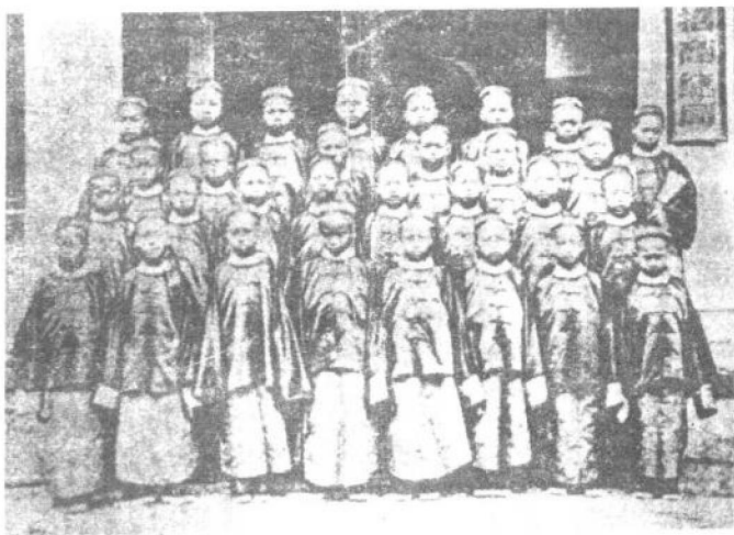
1872年(同治十一年)中国选送第一批留美幼童启程赴美前摄于上海“轮船招商总局”门前。