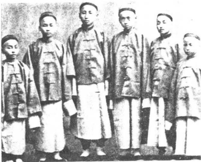
1872年(同治十一年)首批中国幼童抵达加州旧金山,时为九月十三日。