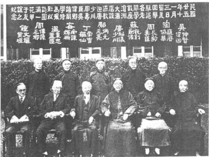
民國二十五年（1936年）部分留美幼童攝于上海。