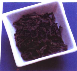
茶王 - 大红袍