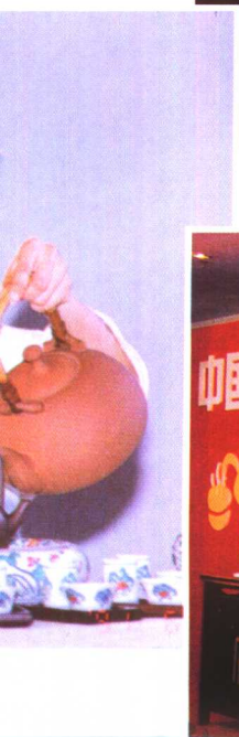
↓ 安溪工夫茶茶艺表演