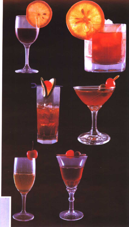
← 浪漫音乐红茶茶艺