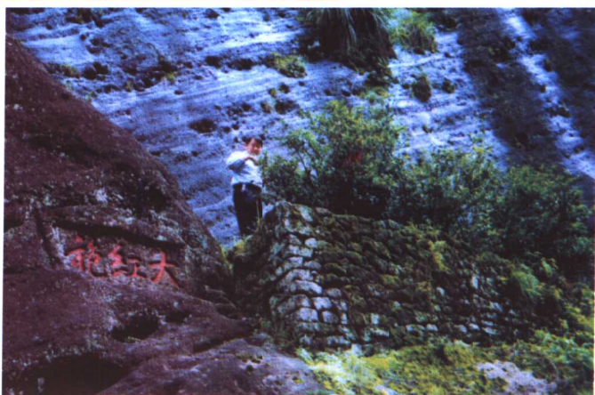
→ 作者在采摘茶王大红袍