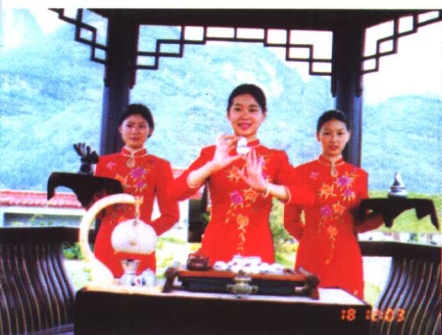
↑武夷山红袍公司工夫茶艺表演