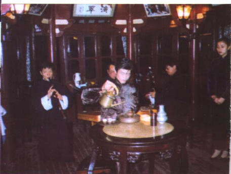
↑上海湖心亭茶艺馆茶艺表演。