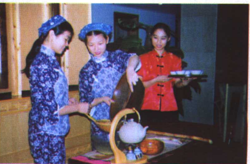
↑武夷山红袍公司擂茶茶艺表演