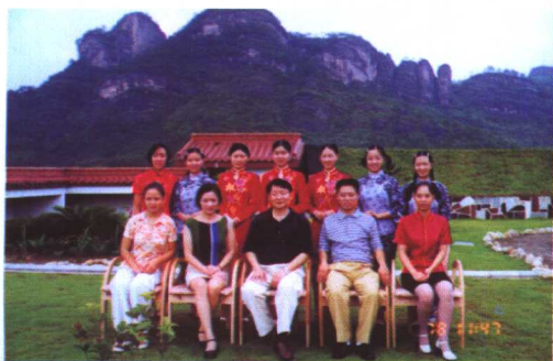
↑作者与红袍公司第六届茶艺培训班学员合影。