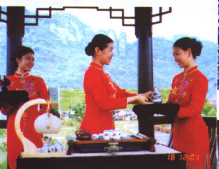
↑武夷山红袍公司工夫茶艺表演