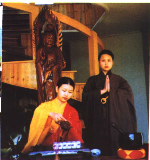
↑武夷山红袍公司禅茶表演