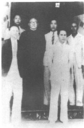
陶行知在锡兰科仑坡 留影 穿深色衣服的是陶 行知