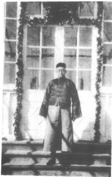
1923年11月，陶行知给妹文漾写信道：“知行近日买了一件棉袄，一双布棉套裤，一顶瓜皮帽，穿在身上，戴在头顶，觉得完全是个中国人……”。图为此时留影