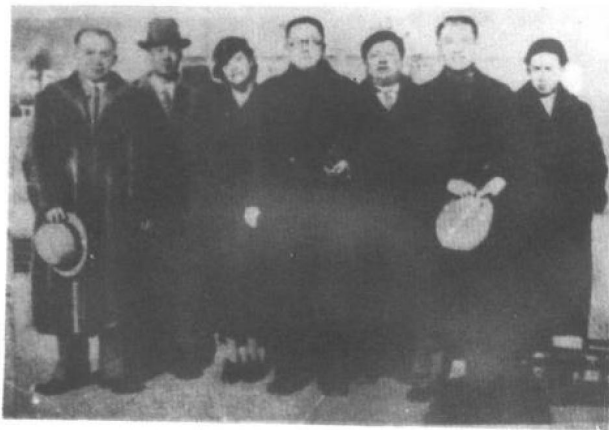
1937年冬，陶行知在加拿大宣传抗日与发动援华运动