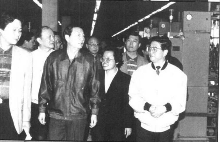
朱鎔基在上海市領導人黃菊、徐匡迪陪同下考察上海安達棉紡織廠。