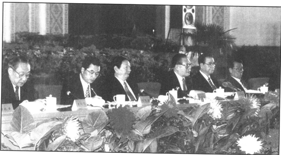
中共中央政治局七常委出席一九九八年十月十二日至十四日在京舉行的中共十五屆三中全會。