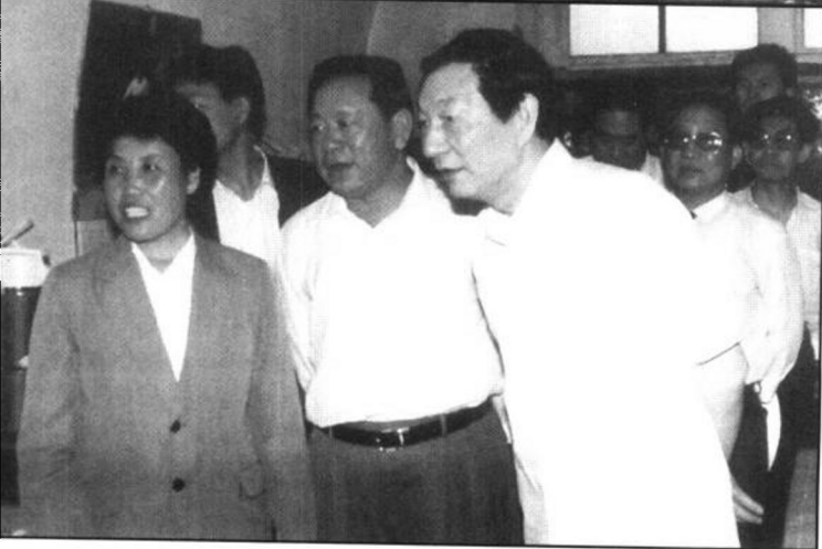
朱鎔基在大寨考察