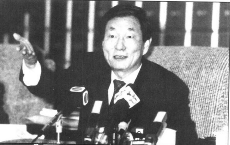
朱鎔基對中國經濟發展前景的信心，溢於言表。