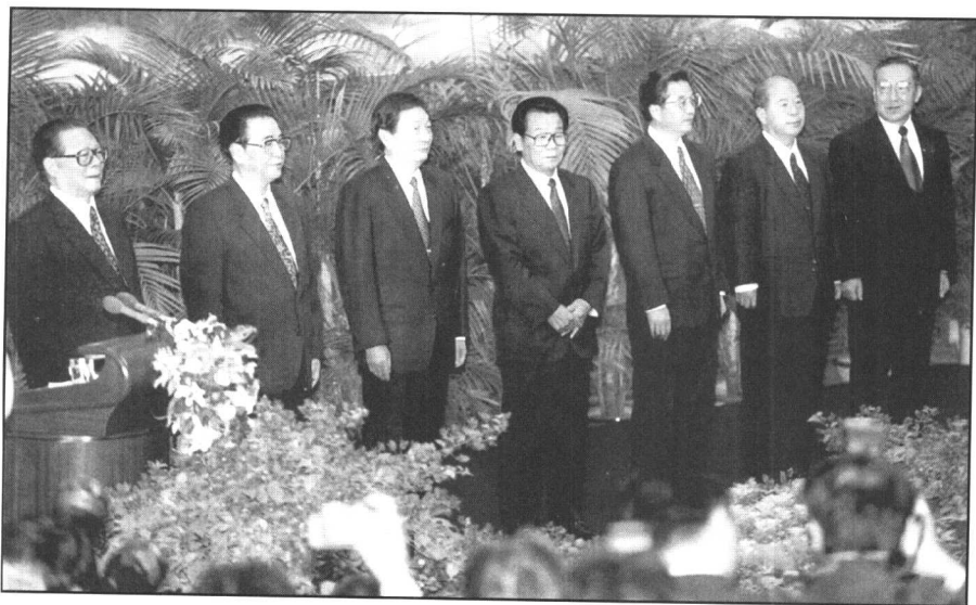
一九九七年九月十九日，中共十五屆一中全會選出的中央政治局七名常委江澤民、李鵬、朱鎔基、李瑞環、胡錦濤、尉健行、李嵐清，在人民大會堂同中外記者見面。