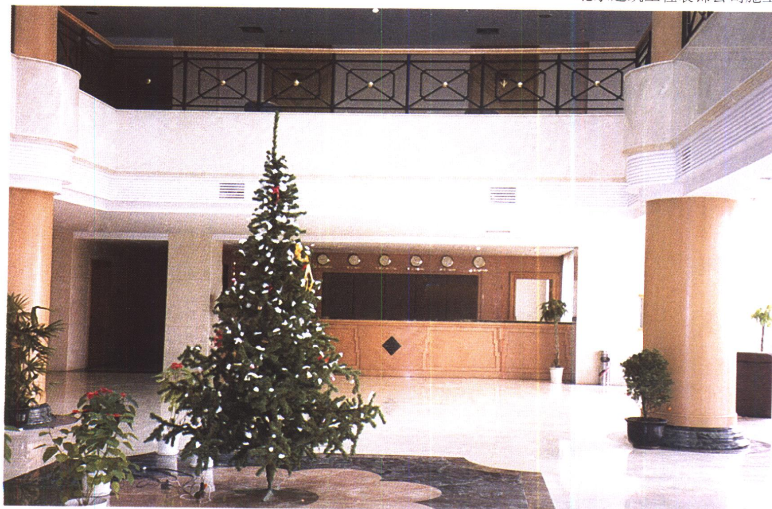
江苏省镇江东郊宾馆大堂 镇江市建筑装饰工程公司施工