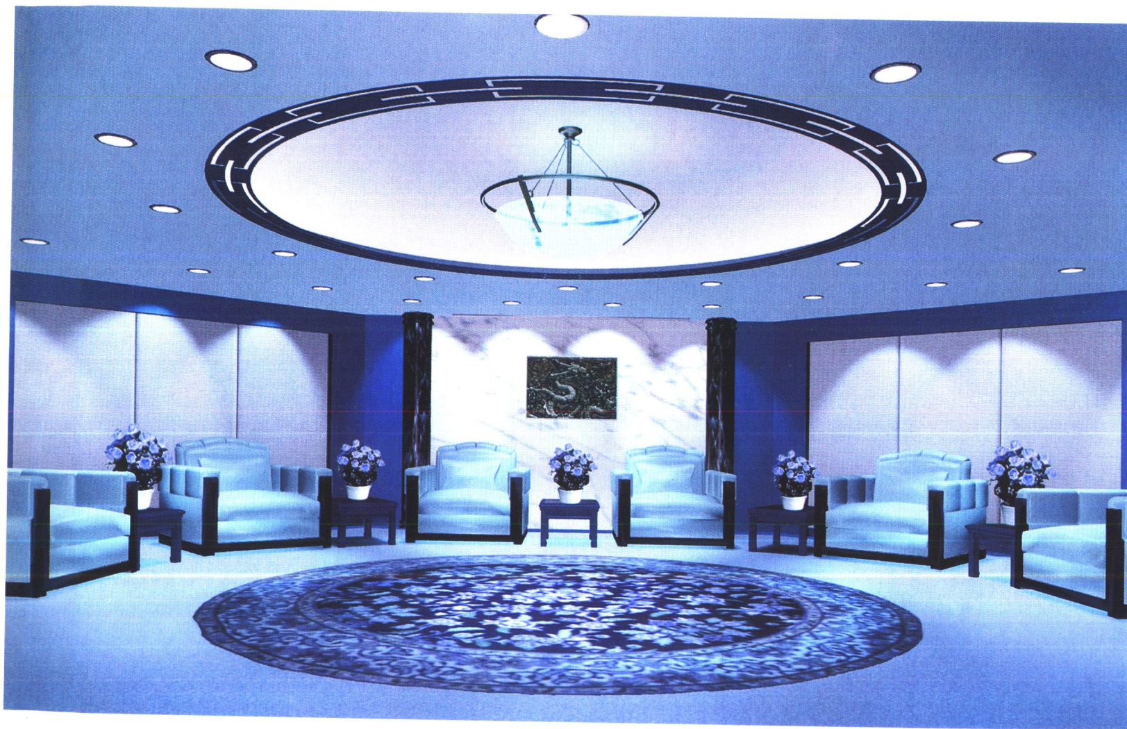
北京信达金融中心大厦接见厅 北京燕佳建筑工程有限公司施工