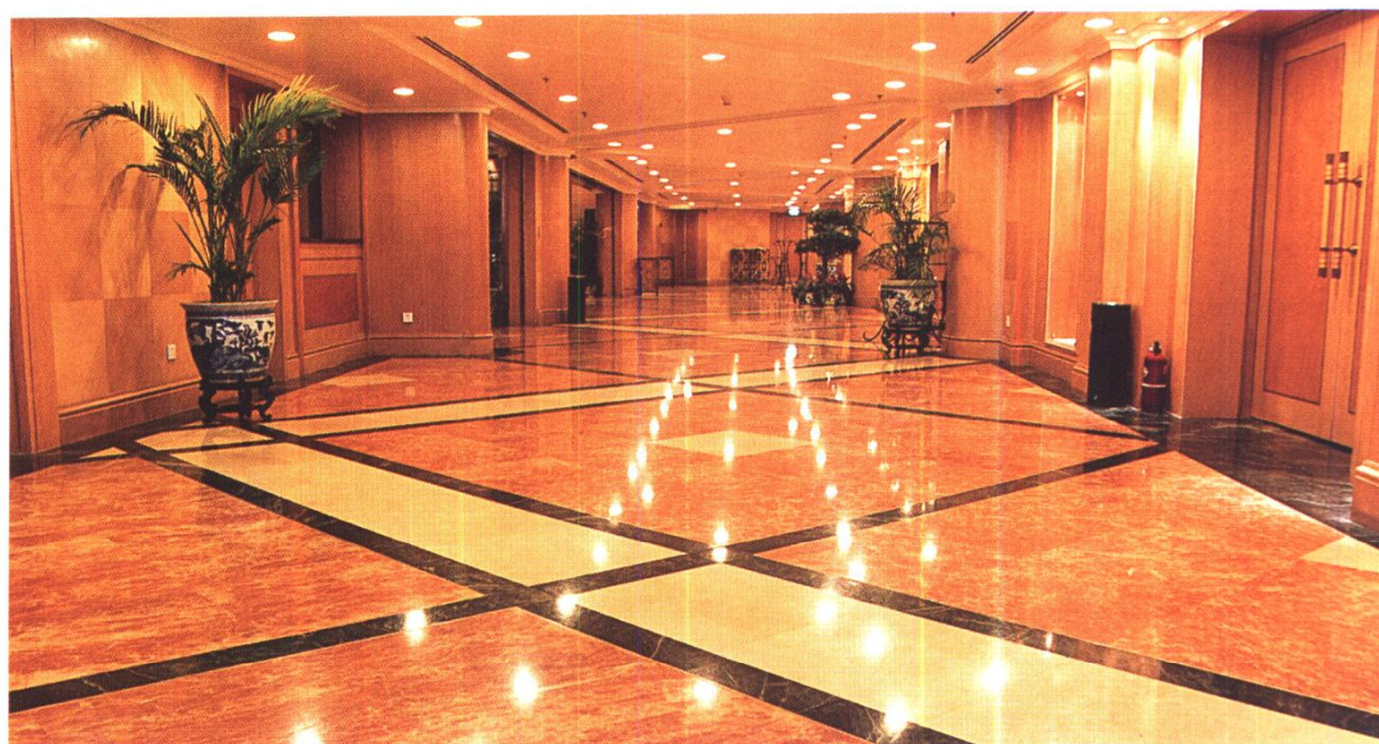
北京亮马河大厦 大宴会厅外走廊 北京港源建筑装饰 工程有限公司 施工