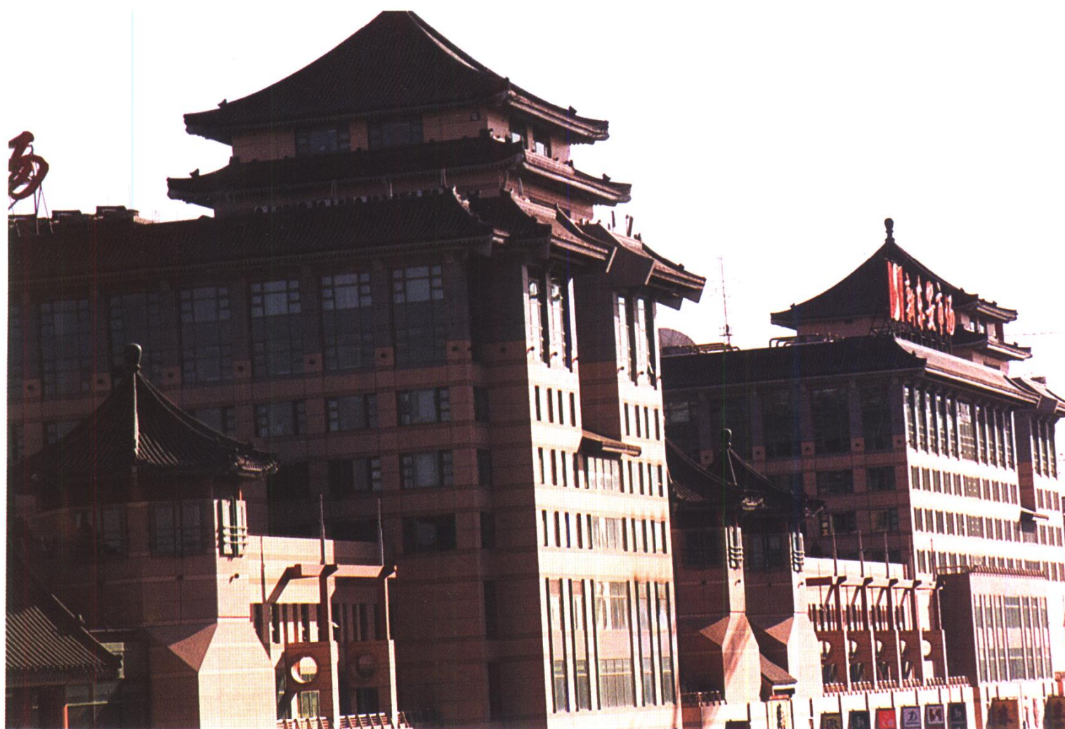
新东安市场屋面外观 北京城建亚泰公司古建分公司施工