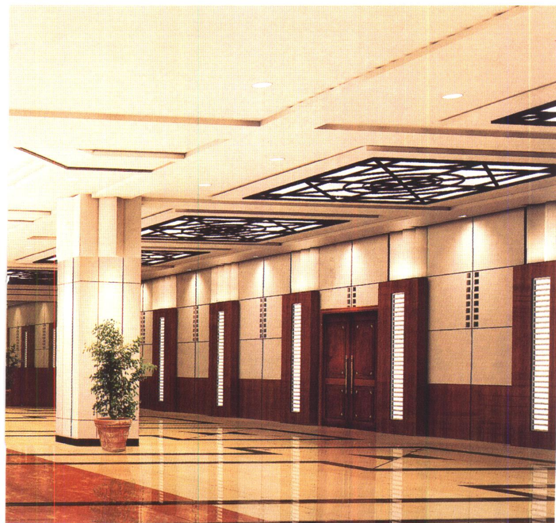
民航计算机业务综合楼大厅装修方案 北京港源建筑装饰工程有限公司