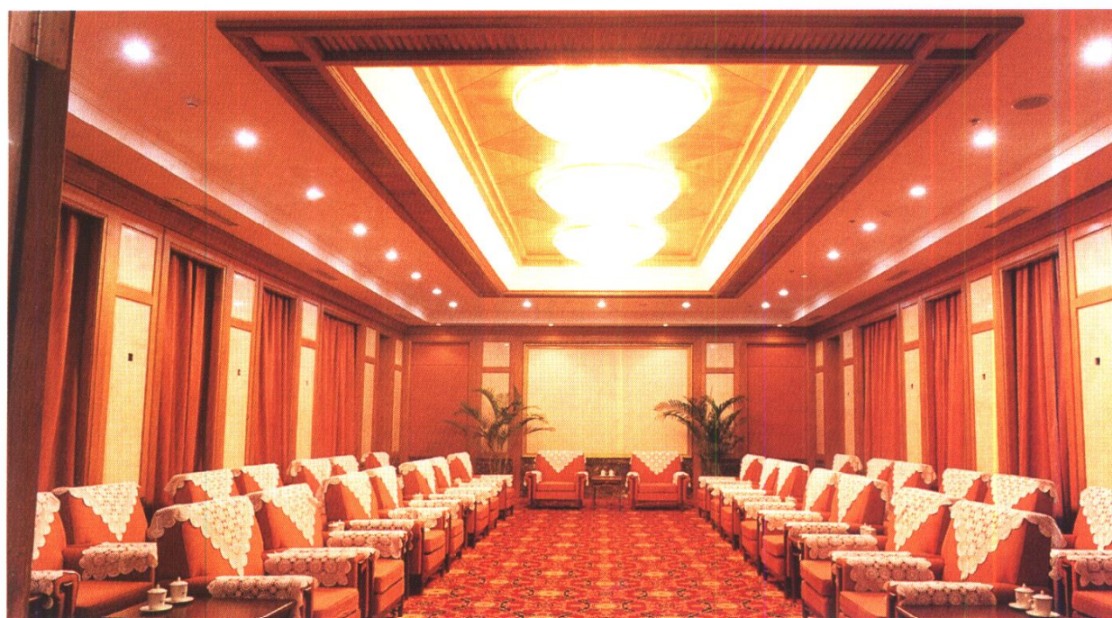
北京顺义宾馆会 议厅 北京侨信装饰工 程有限公司施工