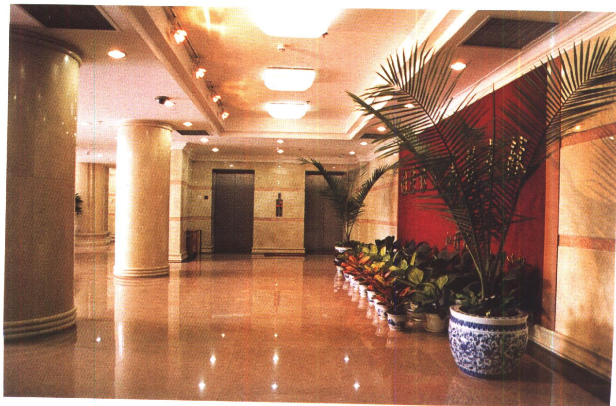
中国五矿公司办公楼门厅 中国新兴建设开发总公司施工