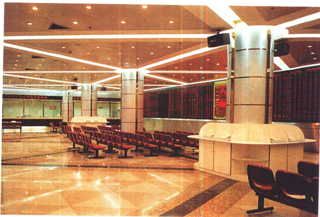
中经信证券交易部营业大厅 中信室内装修工程公司施工