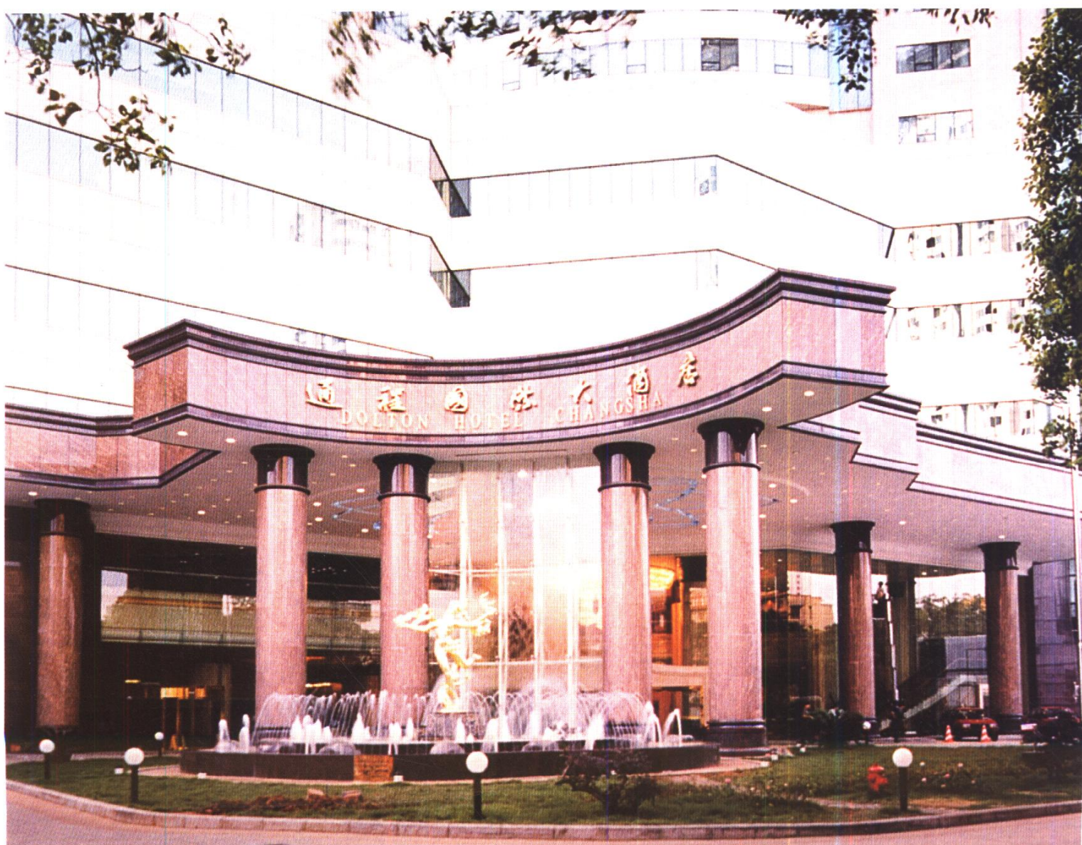
长沙通程国际大酒店入口 中建三局装饰设计工程公司施工