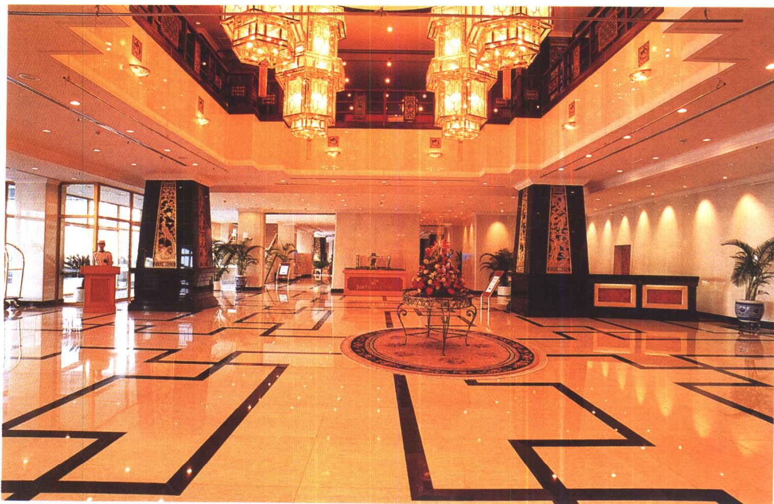
翠宫饭店大堂 北京建筑工程装饰公司施工