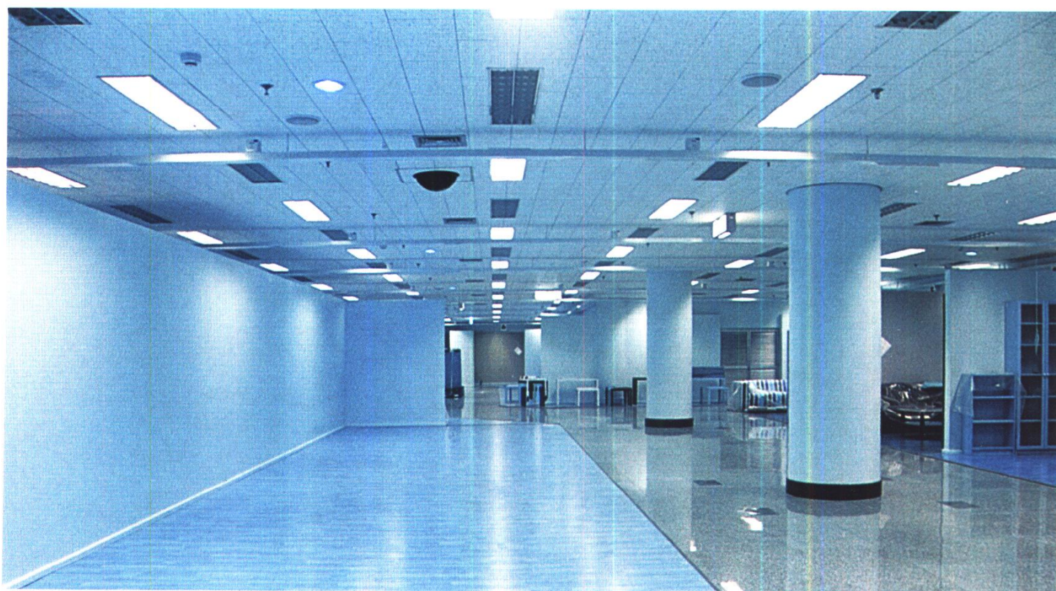
北京某家具店营业大厅 北京住总装饰公司