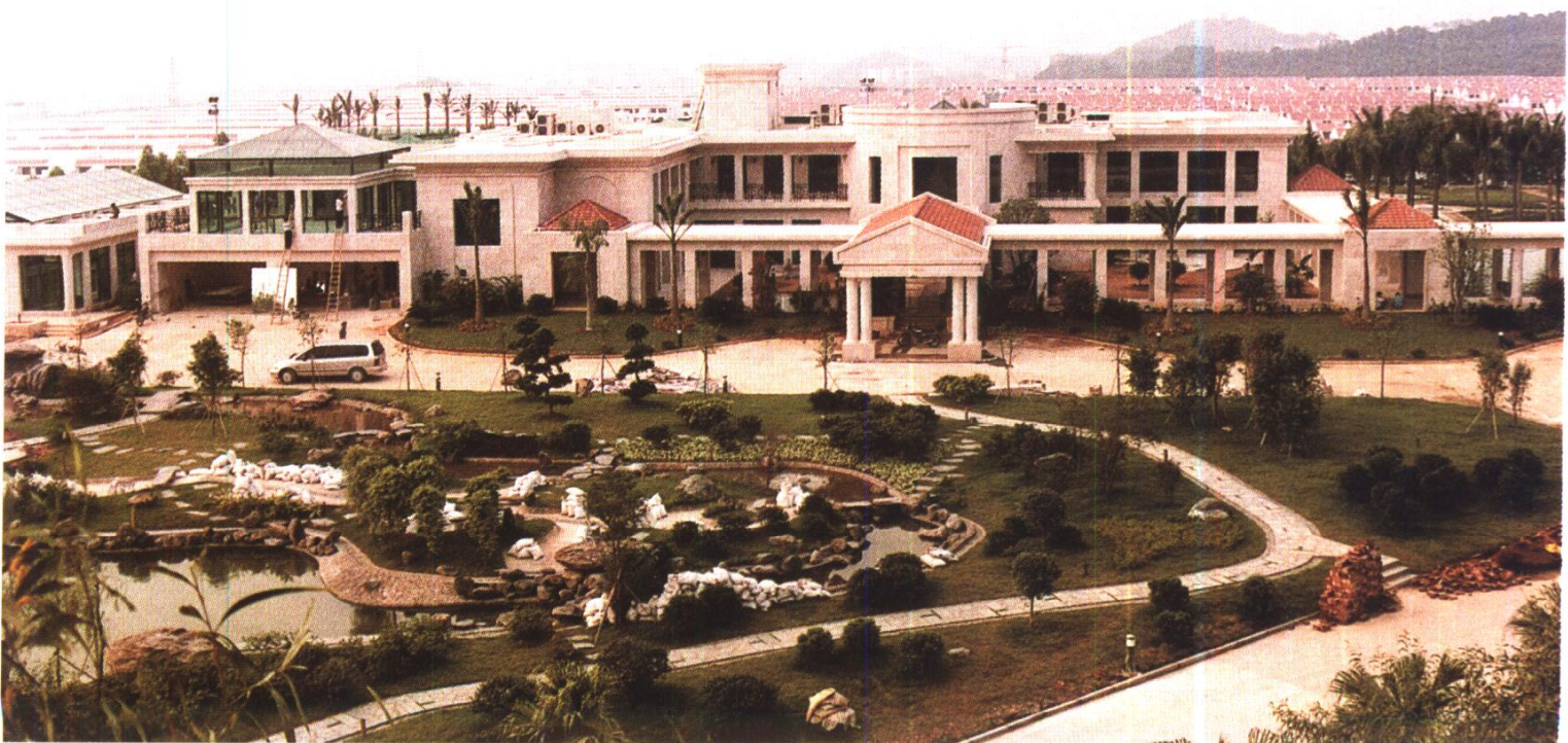
某私人别墅全景 广东省建筑装饰工程公司施工