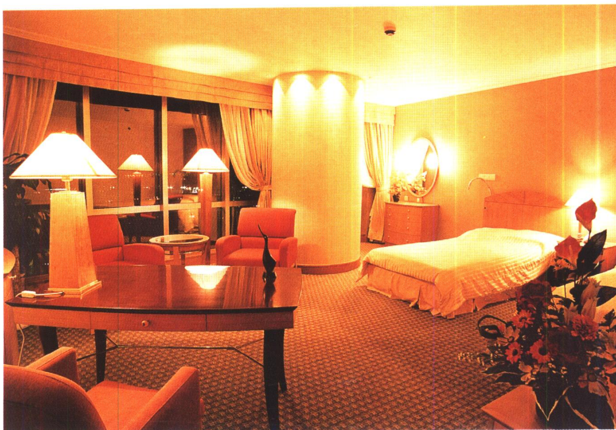
大连希尔顿酒店豪华客房 中建一局(集团)北京建谊建筑工程有限公司施工