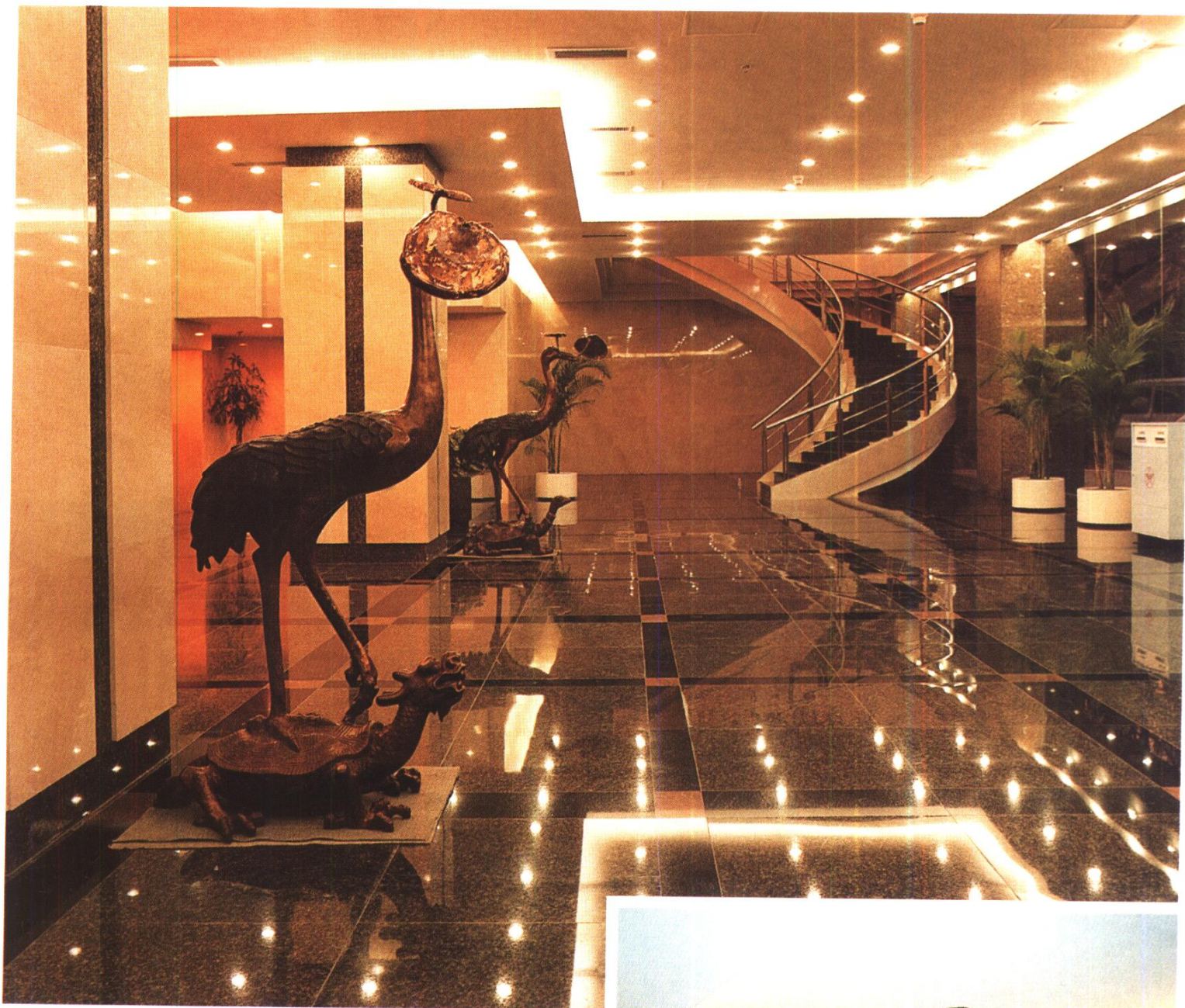
航天长城大厦入口门厅 中信室内装修公司施工