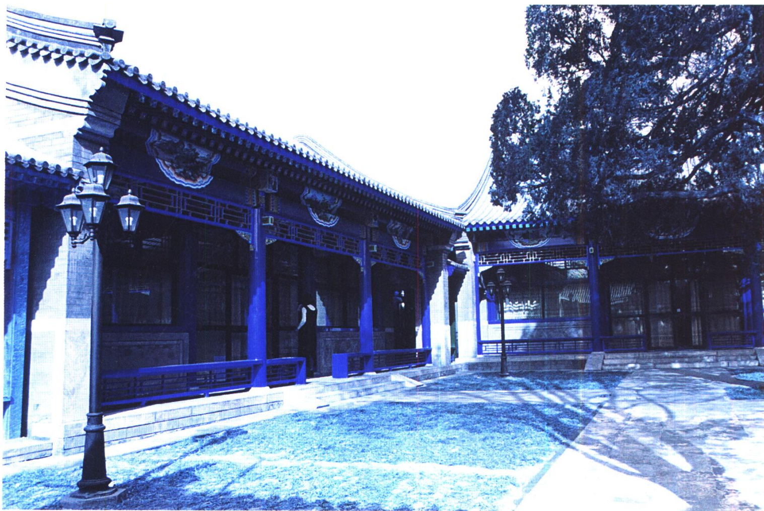
柳荫街 24 号院庭院内景 北京市第一房屋修建工程公司二处施工