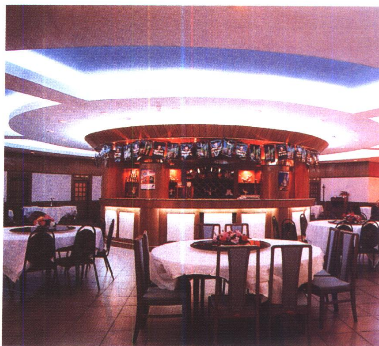
中建大厦大餐厅 北京中建银舍建筑装饰有限公司施工