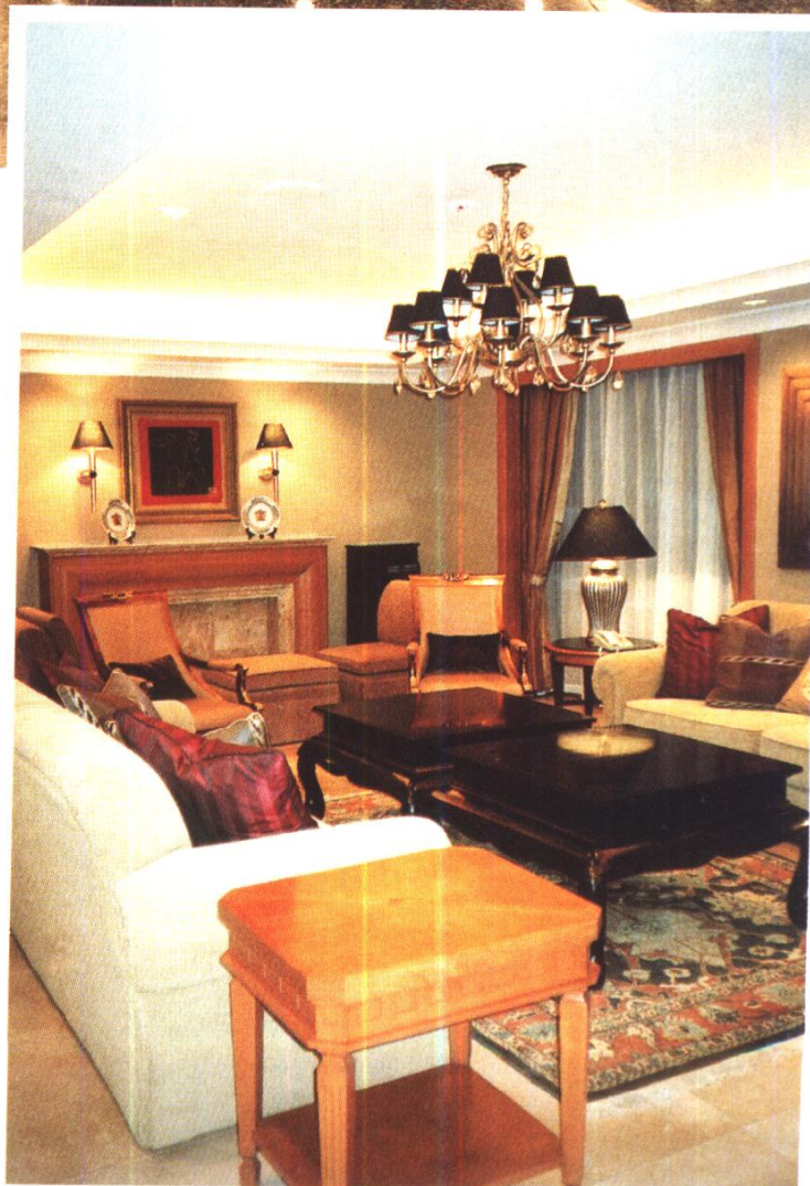
哈尔滨东方大酒店套房客厅 深圳海外装饰工程公司施工