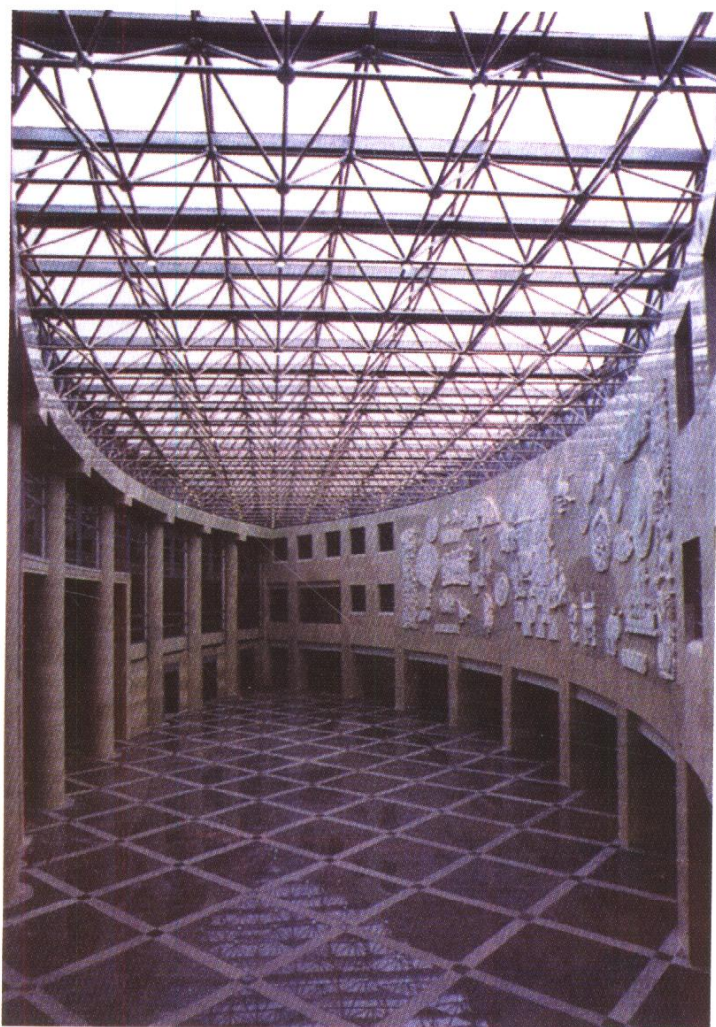
外交部大楼橄榄厅 北京市建筑工程装饰公司施工