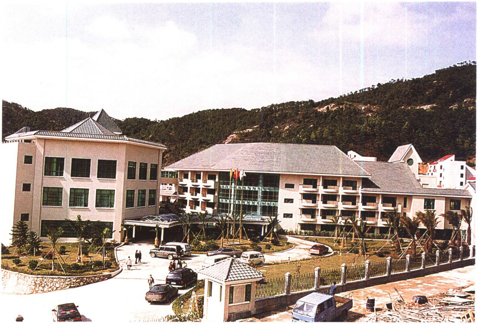
融园山庄全景 广东省建筑装饰工程公司施工