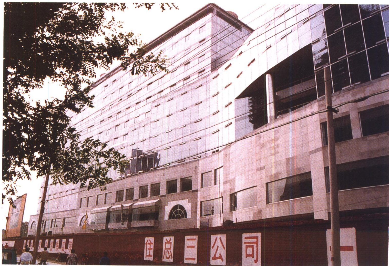
华普大厦外立面 北京市住总集团三公司施工