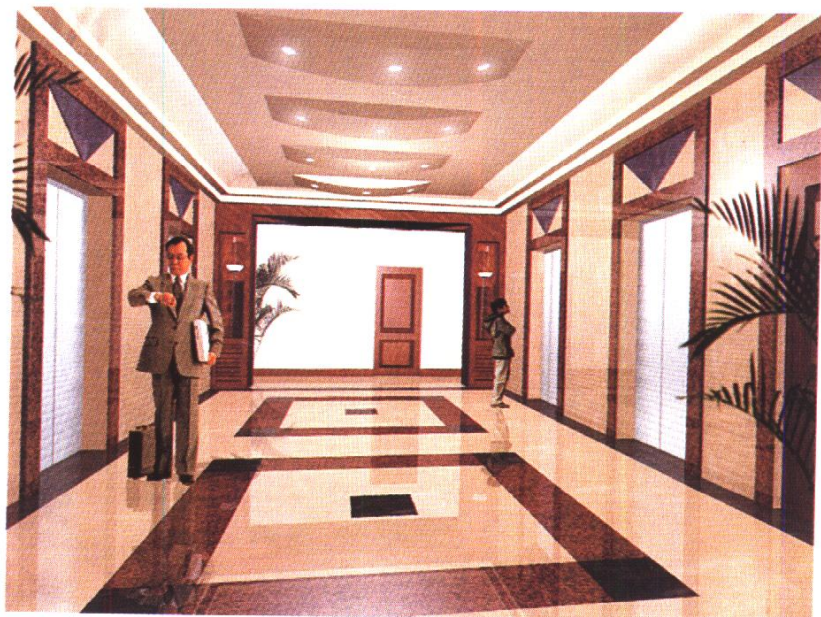
山东省济南市驻京办事处电梯厅 北京丽贝亚建筑装饰工程有限公司施工