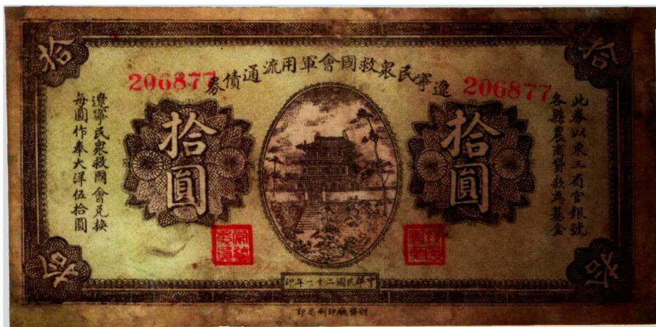
图1—16 辽宁民众救国会军用流通债券 原品尺寸17.2厘米×8.6厘米

还有如辽宁民众救国会军用流通债券（图1—16），在纸币上明确表明是债券。这些都是纸币收藏的范围。