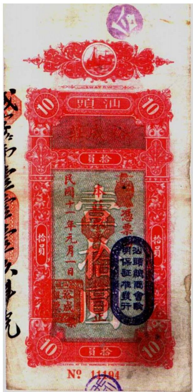
图1—10 汕头裕成庄票10元 原品尺寸10.2厘米×21.3厘米