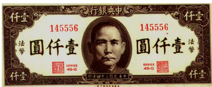
图2—9 中央银行法币 原品尺寸15.5厘米×6.6厘米

所谓法币，是指在法律上赋予流通权力的货币。凡是用法币作支付工具，任何人不得拒绝收受，如果拒不行用，即作为犯法。法币虽然不能兑现，但在法律上保障它具有支付的能力。国民党政府在1935年11月3日公布法币条例称：“自11月4日起以中央、中国、交通三银行所发行的钞票定为法币，所有完粮纳税及一切公私款项之收付，概以法币为限，不得使用现金，违者全数没收。”以后12月又增加了中国农民银行纸币为法币。