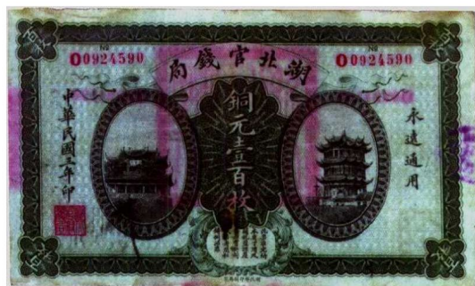
图2—3 湖北官钱局铜元票 原品尺寸13.7厘米×8.1厘米

通常各官银局、官钱局的银两票、铜元票、制钱票为直式，而银元票为横式。少数省的官银钱局延续到民国初期，则其票面取消了双龙，如湖北官钱局民国三年的铜元票（图2—3）、四川官钱局的制钱票（图2—4）等，同时票式改为横式。