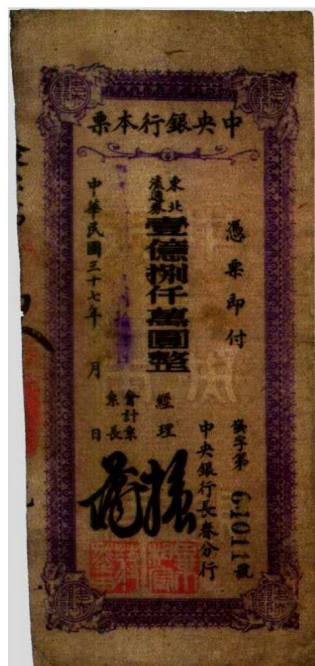
图1—5 东北流通券本票 原品尺寸7.6厘米×17.2厘米