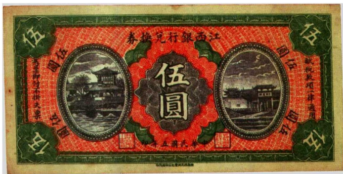
图2—8 江西银行兑换券 原品尺寸17.7厘米×8.8厘米

民国初期发行的兑换券，都能直接兑换银元、铜元。如果宣称不能兑换则银行要发生挤兑，严重时会使银行倒闭。但后来纸币发行过滥，均不能实现兑换，因此称兑换券也好，印有凭票即付也好，均失于兑换券的意义。