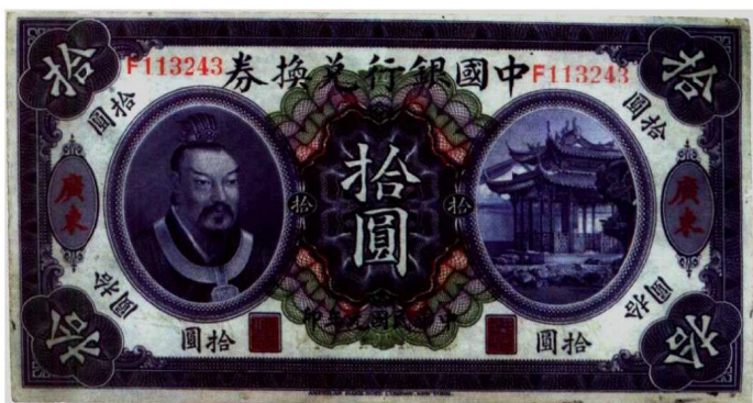
图2—5 中国银行兑换券 原品尺寸17.7厘米×9.4厘米

为了便于纸币流通，有的银行早期发行的纸币就直接称为兑换券。如中国银行兑换券（图2—5）、四川兑换券（图2—6）、贵