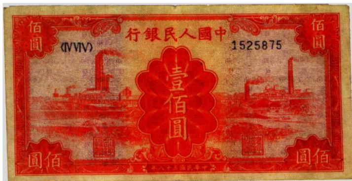
图1—1 中国人民银行100元的流通券 原品尺寸13.1厘米×6.7厘米

1. 流通券和样本票：流通券是政府明令允许发行的可流通纸币，上有面值，可作为支付手段并在市场上流通。例如中国人民银行第一套人民币100元券（图