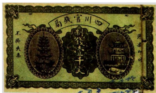
图2—4 四川官钱局制钱票1000文 原品尺寸13.4厘米×7.9厘米