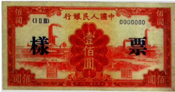
图1—2 中国人民银行100元的样本票 原品尺寸13.1厘米×6.7厘米