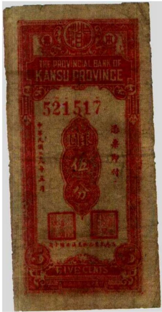
图1—6 甘肃省银行银元5分本票 原品尺寸4.7厘米×10.1厘米