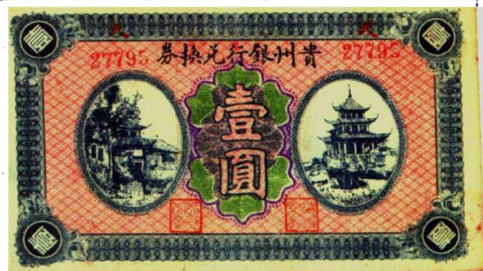
图2—7 贵州银行兑换券 原品尺寸13.7厘米×7.9厘米

1949年国民党政府在撤离大陆前，以中央银行名义发行过银元券，各省还发行过银元辅币券，尽管也在纸币上印有“凭票兑换银元”、“积成拾角兑换银元壹元”等，但均是一句空话，从未见能兑换银元之事实。因此不能称作兑换券。