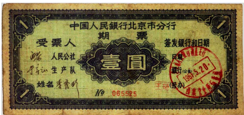
图1—17 中国人民银行北京市分行期票 原品尺寸15.8厘米×7.4厘米

期票是到期支付不计利息的现金凭证。我国在1961—1962年期间因经济困难，由各省中国人民银行发行期票。规定一年后到期才能支付。例如