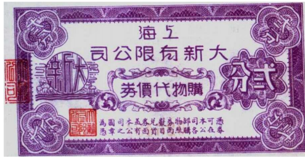
图1—7 大新有限公司代价券2分 原品尺寸9.7厘米×5.4厘米