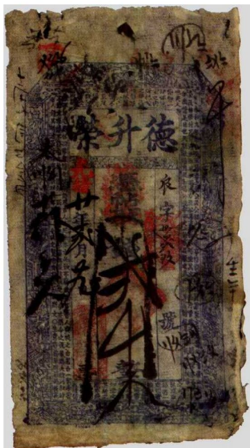
图1—13 德升荣的私帖 原品尺寸11.5厘米×21.0厘米

票、支票，无论是面值、年号、编号等均用手写，并有签和发的单位名称，可以支取现金，但对不认识的支取者要有保人。例如万春堂徐开给福顺德宝号的兑票（图1—14），这种票券的性质已介于支票和流通券之间，严格来讲不能属于纸币，因为每一张均不同。