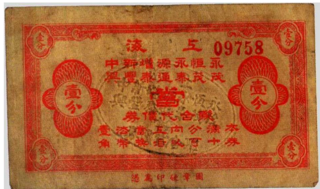
图1—9 当铺联合代价券1分 原品尺寸11.0厘米×6.7厘米

4. 庄票和村票：庄票或称钱庄票，大多数为直型，面值以吊、串、文为单位，系私人钱庄发行，在当地流通。这些庄票因为发行量少，其编号年代有时用手写，十分重视所盖的印章。这种庄票现发现的大多在山东、山西、湖南、东北等地，种类很多。例如广东汕头裕