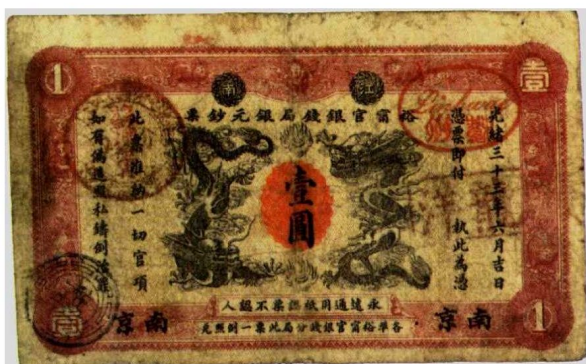
图2—2 裕宁官钱局银元票 原品尺寸14.8厘米×8.8厘米