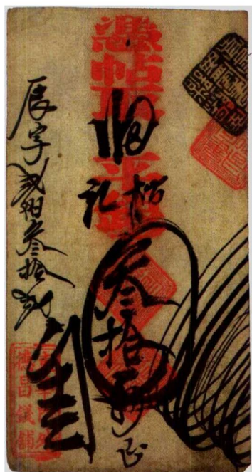
图1—12 德昌钱铺的私帖 原品尺寸9.1厘米×17.2厘米