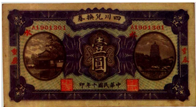
图2—6 四川兑换券 原品尺寸14.7厘米×8.0厘米