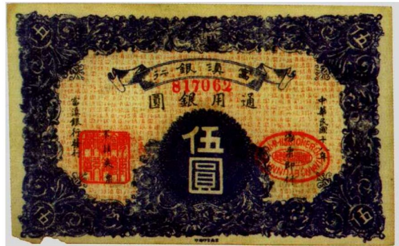
图1—3 富滇银行民国18年5元券 原品尺寸14.6厘米×9.2厘米

流通券中可以用来兑换金属货币的称兑换券。民国24年以前的流通券按规定和金属货币（如袁大头银元）是等值的，可以兑换银元，称兑换券。但实际上很多是不能兑现的，名存实亡。例