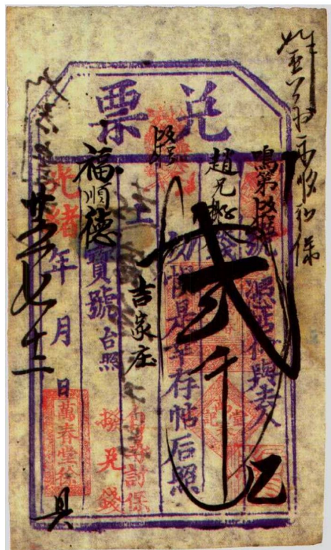
图1—14 万春堂徐的兑票 原品尺寸12.0厘米×20.5厘米

背面印有每元作江钱120吊，并在付息时印有年代记号。奉天兴业银行也发行过周年四厘债券。