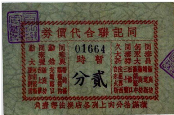
图1—8 同记联合代价券2分 原品尺寸9.1厘米×6.0厘米

括去制造炮弹、枪弹，因此在敌伪占领区里，例如上海等地由商店、公司、工厂等发行许多一角以下的代价券，在市面上代替现金用来找零。一些信誉好的、大的公司或商店，如大新有限公司（图1—7）、新新公司、大世界等均单独发行代价券。小的商店为了提高信誉，组织起来联合发行代价券，如同记联合代价券（图1—8）、当铺联合代价券（图1—9）等，其数量之多已无法统计：