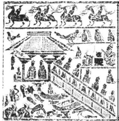
圖一 兩城鎮仙人·水樹人物畫像 東漢