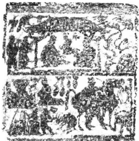
圖二 宴享畫像 東漢

縱養，雁鴛百餘，……長育豚駒」〔六〕，亦如此，同時可看出漢時私家園林中，除植物外又有動物作為賞物。