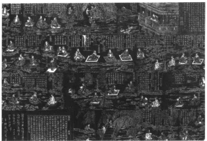
圖三 蘭亭修禊圖 明水樂

化行為（圖三）。王羲之《蘭亭集序》對此有明確表述：『此地有崇山峻嶺，茂林修竹，又有清流急湍，映帶左右，引以為曲水流觴，列坐其次。雖無絲竹管弦之盛，一觴一詠，亦足以暢敘幽情』。這種本因淡泊情懷取之于自然，但又以自然真情來寄托一種追求的行爲，實是一種『逝反』，由大到小再到大，是從『仰觀宇宙之大，俯察品類之盛』到『足以極視聽之娛』，再及『因寄所托，放浪形骸之外』〔一四〕的過程。