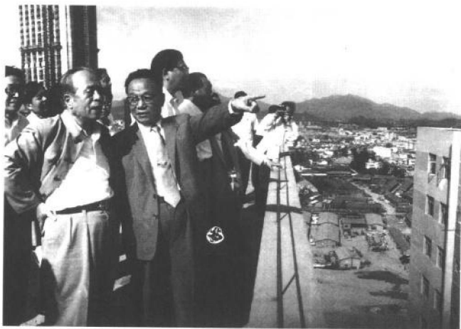
1983年11月，任仲夷（前左一）陪同谷牧（前左二）视察深圳经济特区。