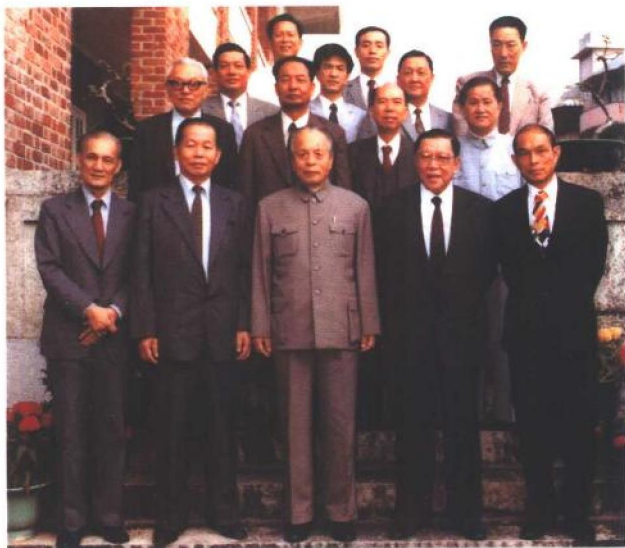
1981年10月29日，任仲夷率团访问澳门期间与港澳知名人士合影。前排右起：霍英东、何贤、任仲夷、柯正平、王匡。第二排右起：曾定石、马万祺、梁湘、李菊生。