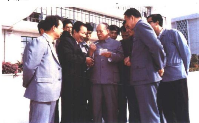
1984年12月，任仲夷（中间持笔记本者）在广东汕头超声仪器研究所与科技工作者一起交谈。