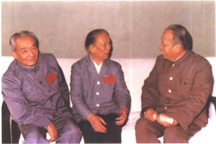
1982年12月3日，任仲夷（右）在北京五届全国人大五次 会议广东代表团驻地，与刘田夫（左）、李坚真（中）研究接受 《人民日报》记者采访谈广东改革开放问题。