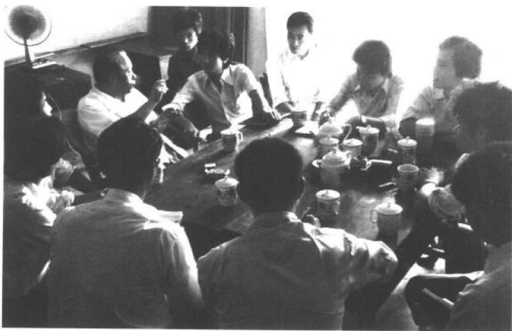
1982年11月，任仲夷（后左一）在广州市嘉美发廊与青年个体劳动者们座谈。