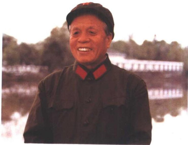
1981年2月，任仲夷在中共广东省委大院（时任中共广东省委第一书记兼广东省军区第一政委）。