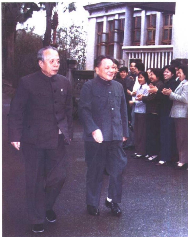
1982年2月7日，任仲夷在广州陪同邓小平接见群众。