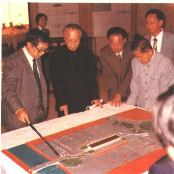
1981年10月27日，任仲夷率团访问香港期间在香港合和大厦听取建设深圳皇岗口岸规划的介绍。左起：胡应湘、任仲夷、梁湘、曾定石。