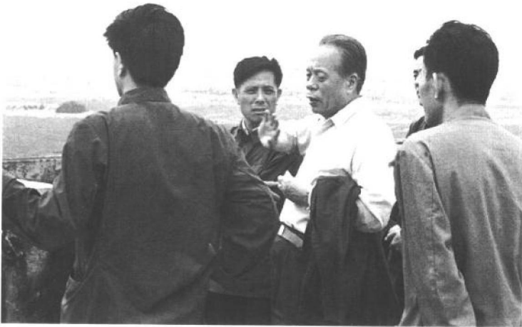
1982年5月13日，任仲夷（左三）在广东海丰县海边与海丰县负责人研究打击走私活动问题。