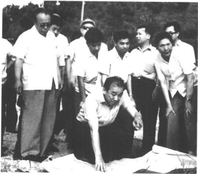
1982年6月，任仲夷（左一）陪同陈慕华（前右一）在深圳蛇口听取袁庚（中蹲者）关于蛇口发展规划的汇报。