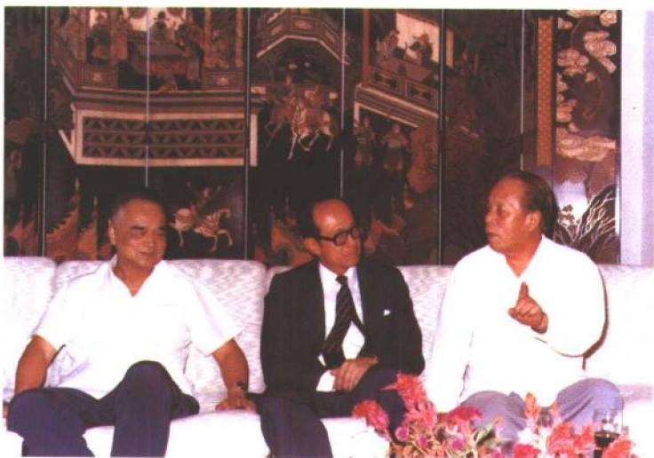
1983年7月29日，任仲夷（右）和梁灵光（左）在广州会见香港知名人士李嘉诚（中），讨论兴办汕头大学事宜。