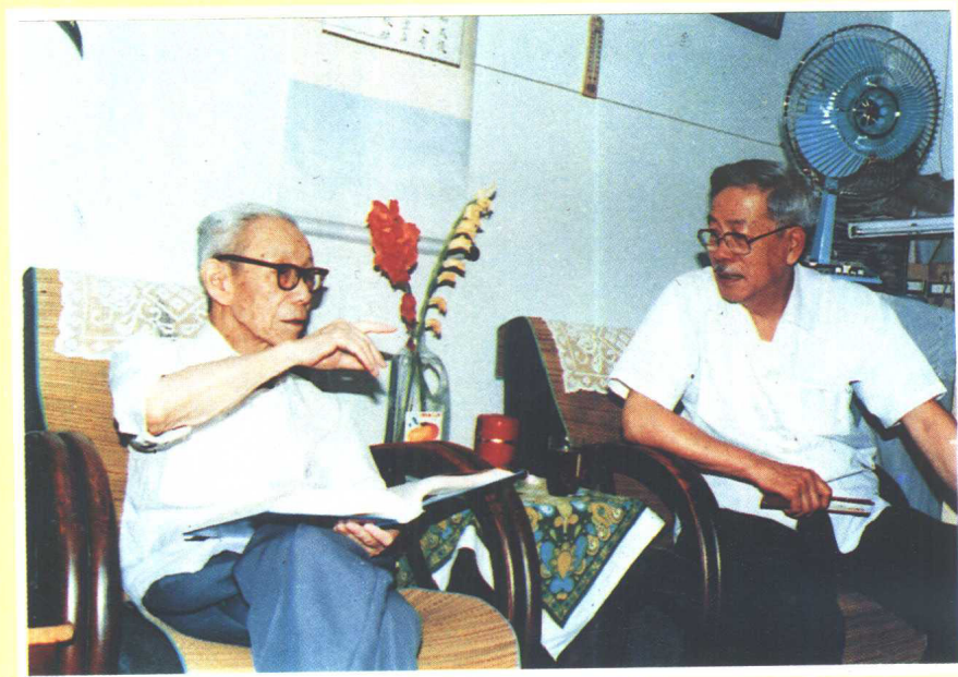
作者和吕叔湘先生（1988年）