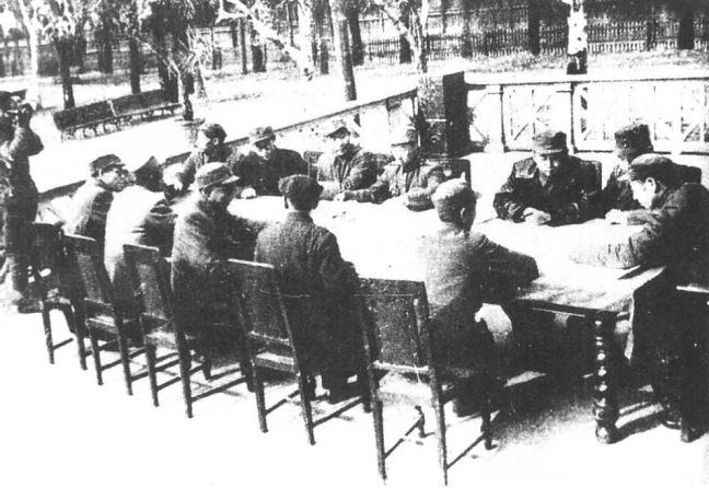
东北局部分领导成员在哈尔滨。