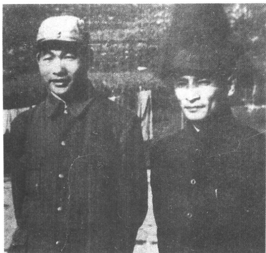
陈云和萧 劲光在临江。