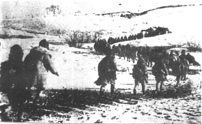
北满我军冒着严寒向松花江以南挺进。