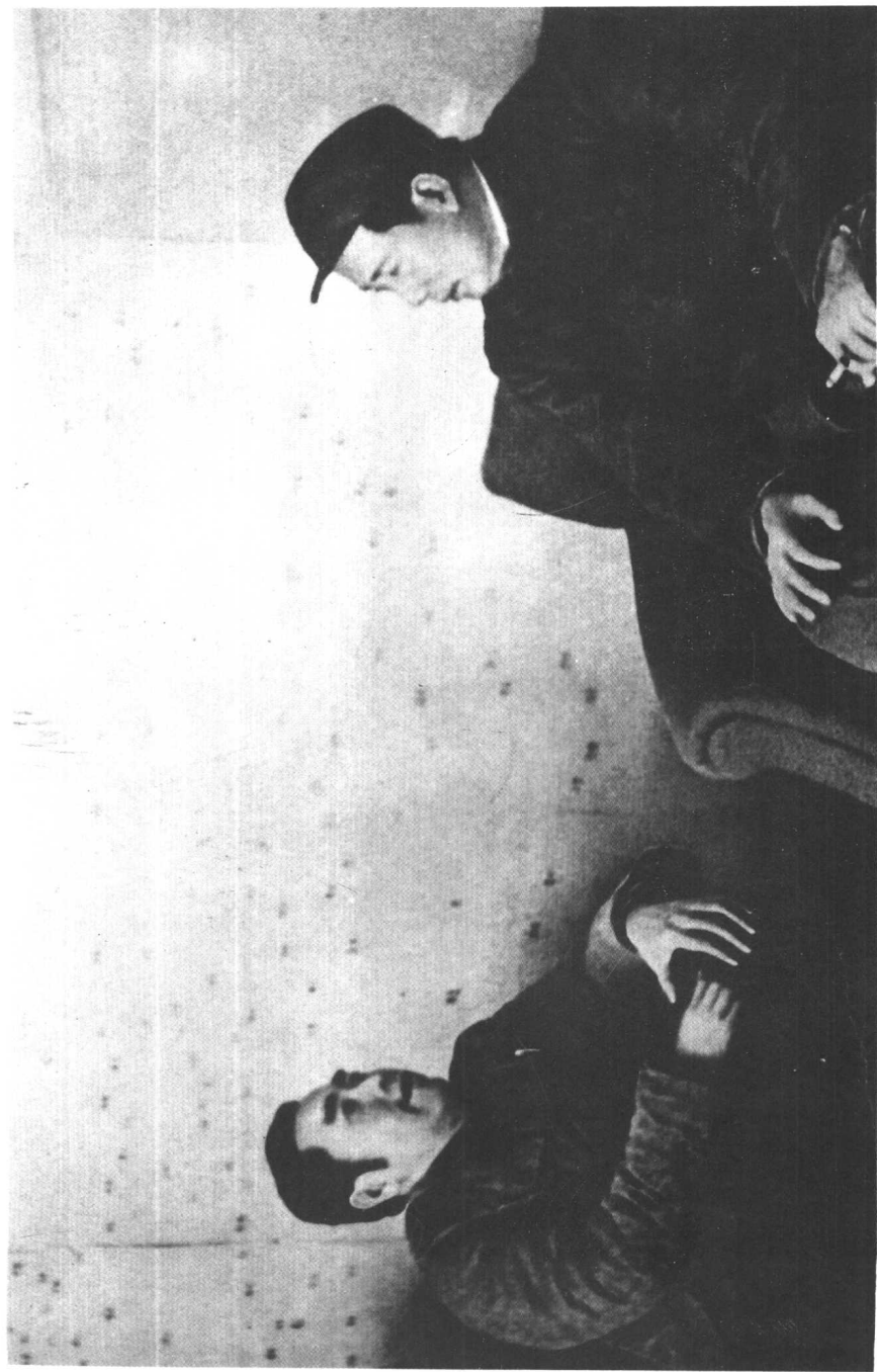
毛泽东和周恩来 1948 年在西柏坡运筹三大战役。