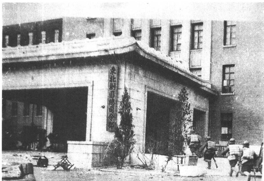
攻占沈阳国民党“剿匪”总司令部。