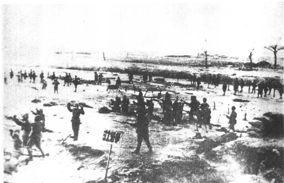
辽西国民党军的覆灭。