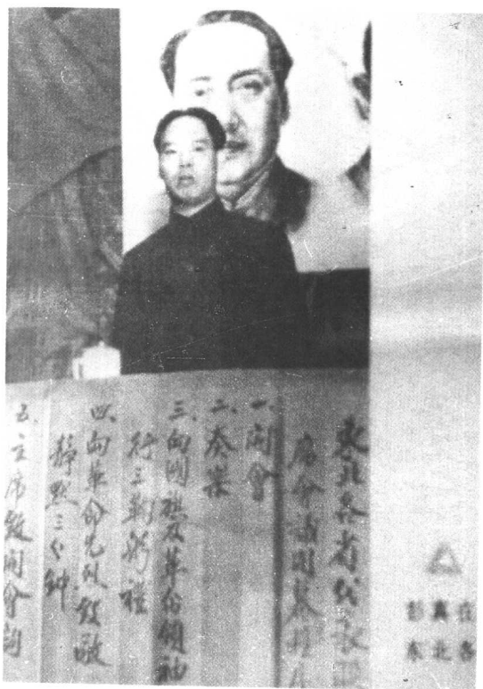
东北战场 上的彭真。