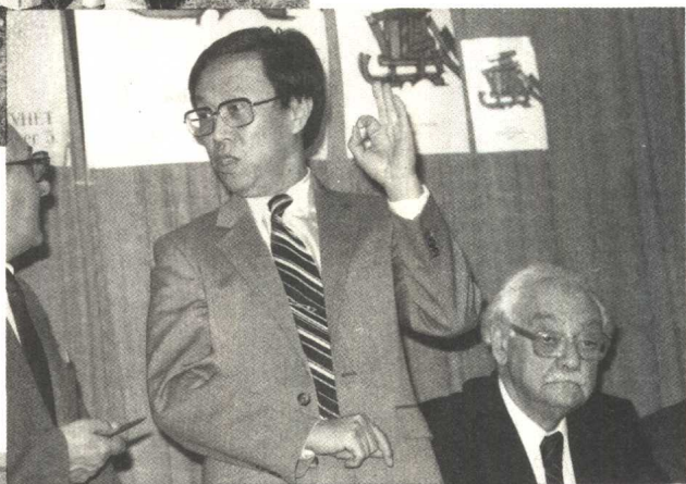
下、1991年9月，王蒙参 加新加坡作家周。