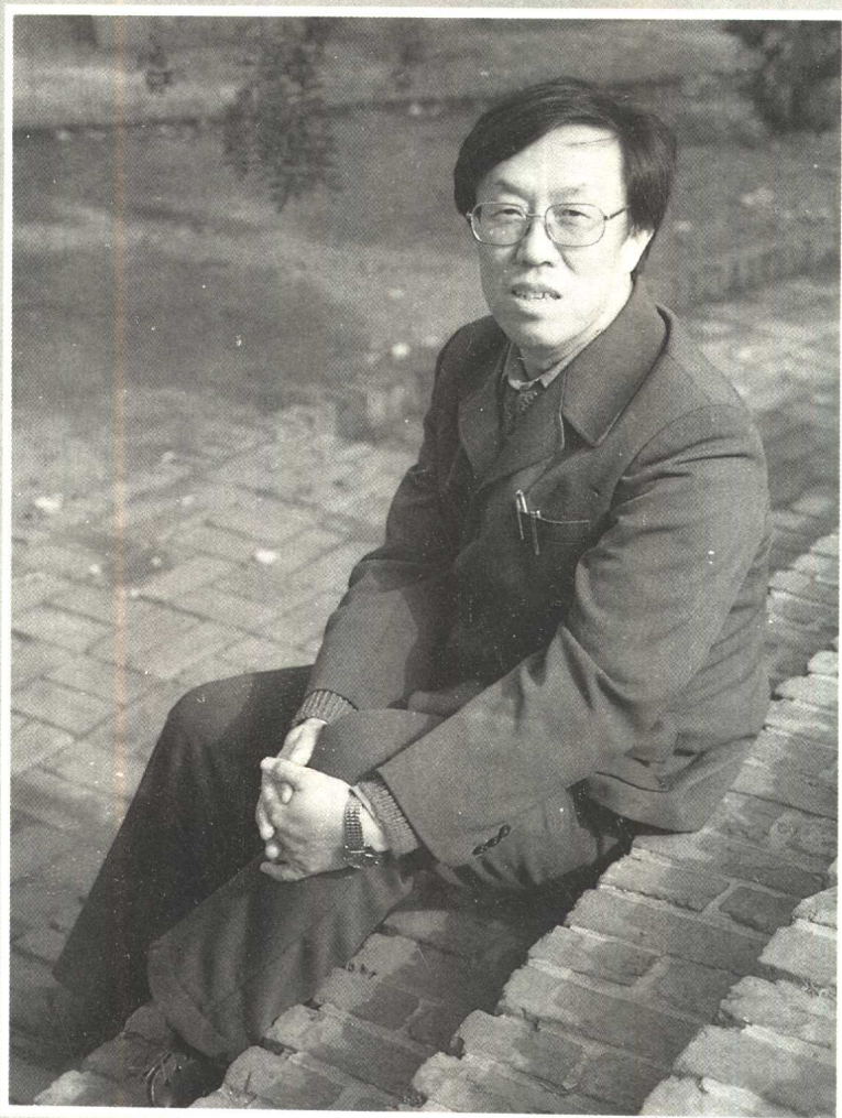
1984 年 10 月