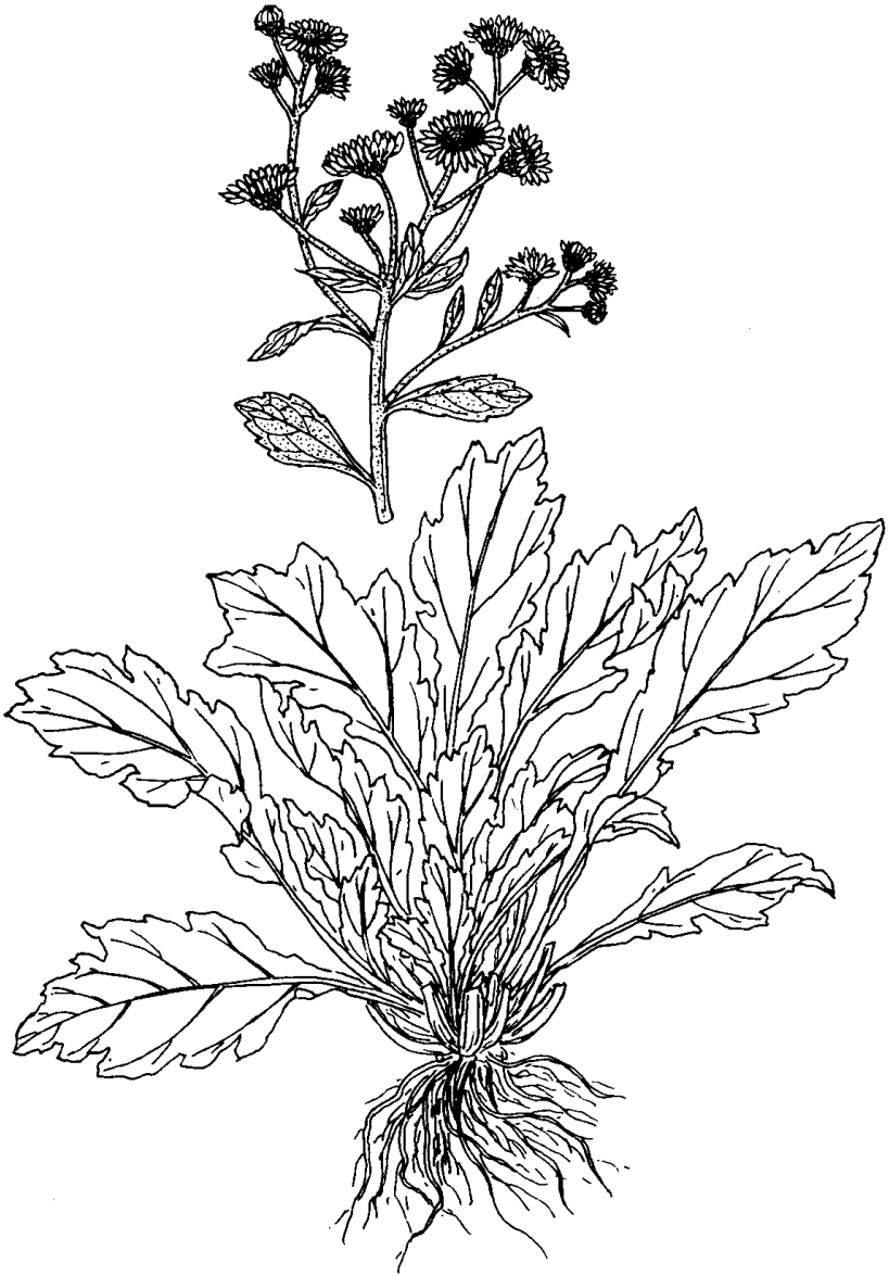
图2 一年蓬 (菊科) Erigeron annuus (L.) Pers.