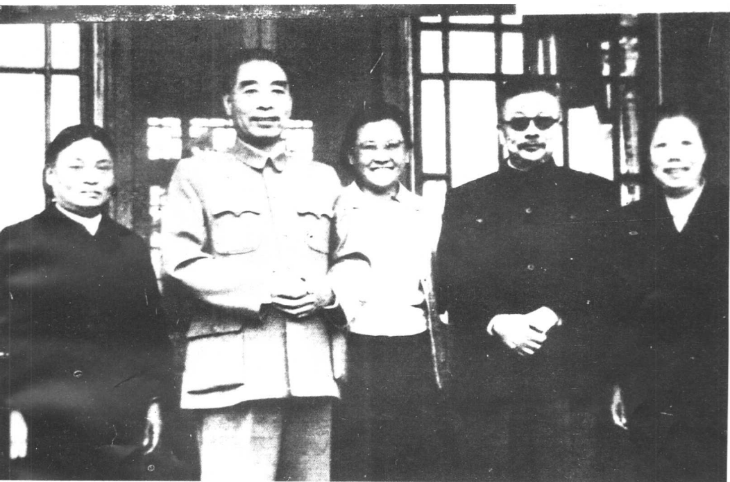
1960年，周恩来、邓颖超探望病中的李克农，并与李克农及夫人赵瑛（左）、女儿李冰合影。