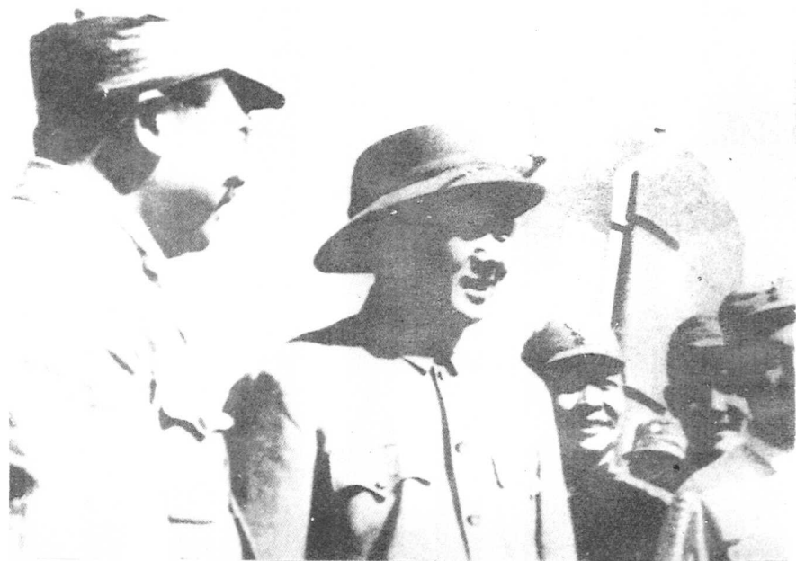
1945年8月毛泽东（左二）赴重庆谈判，李克农（左一）等人在延安机场送行。