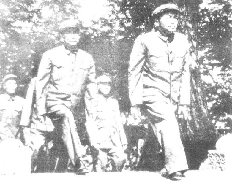
一九五三年七月在朝鲜。李克农（前左）与彭德怀（前右）在朝鲜停战协定及临时补充协议上正式签字前步入会场。