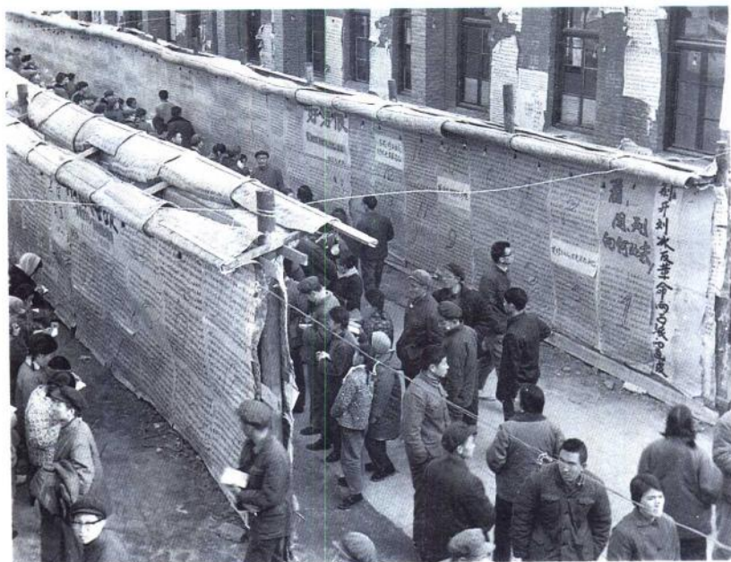
一九七五年十二月同方部北院，“反击右倾翻案风”大字报区