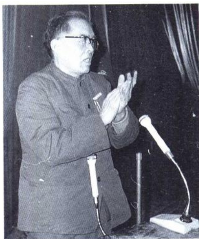
一九七八年十二月作者在兰州大学欢迎会上讲话