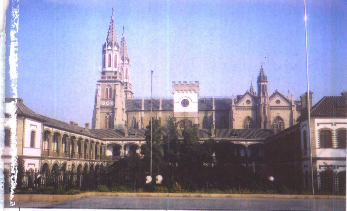
从洪家楼广场看洪家楼天主教堂 (远处)和华北总修(道)院(近处)