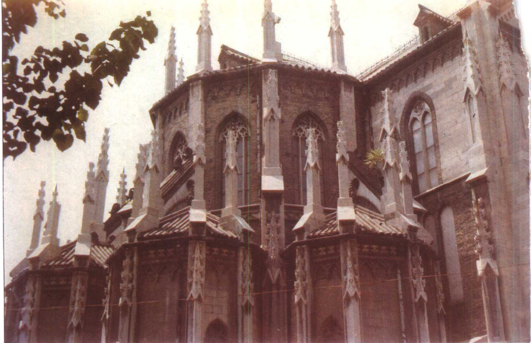
洪家楼天主教堂神坛众多直刺青天的小尖塔