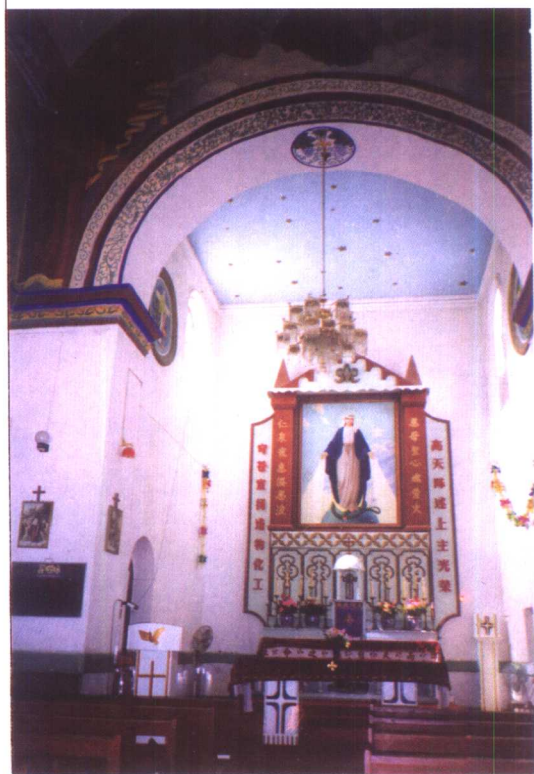
将军庙天主教堂内景