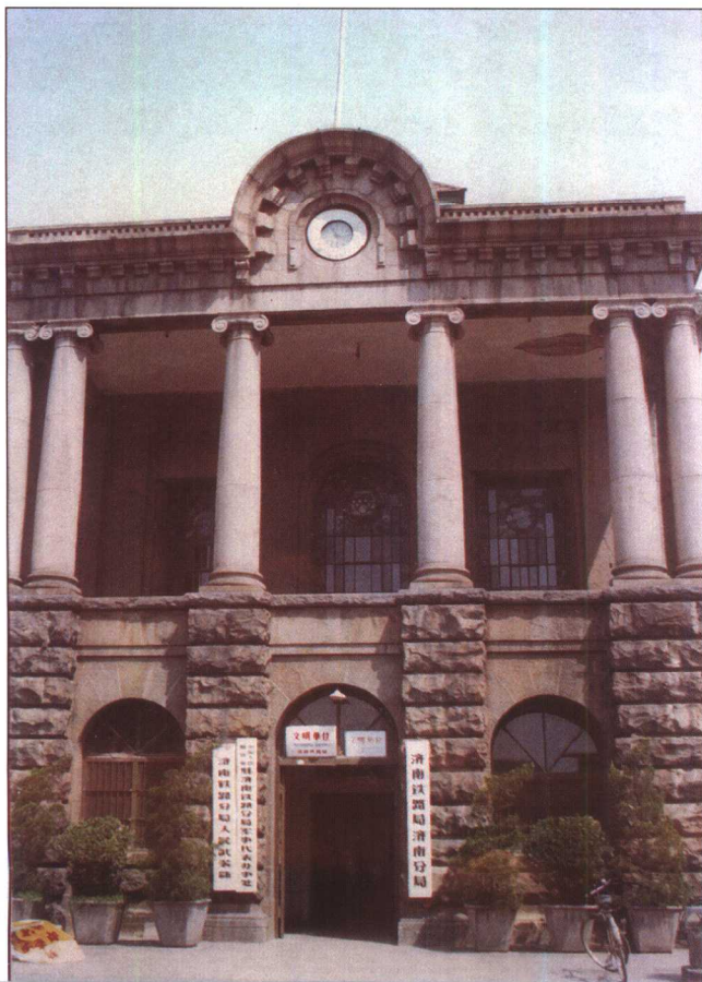
原胶济铁路济南火车站入口柱廊