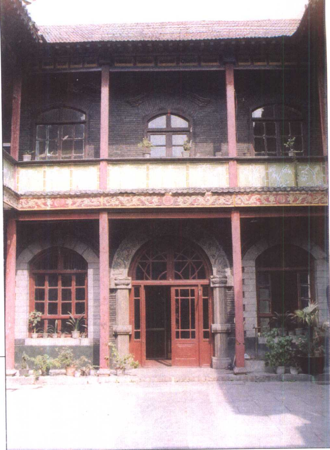
东流水一带的近代民居楼(今五龙潭公园内)