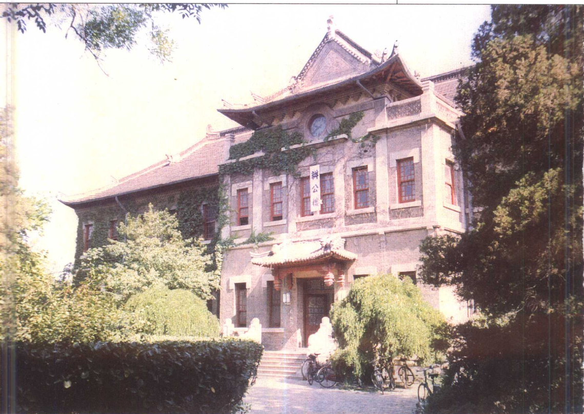
原齐鲁大学办公楼