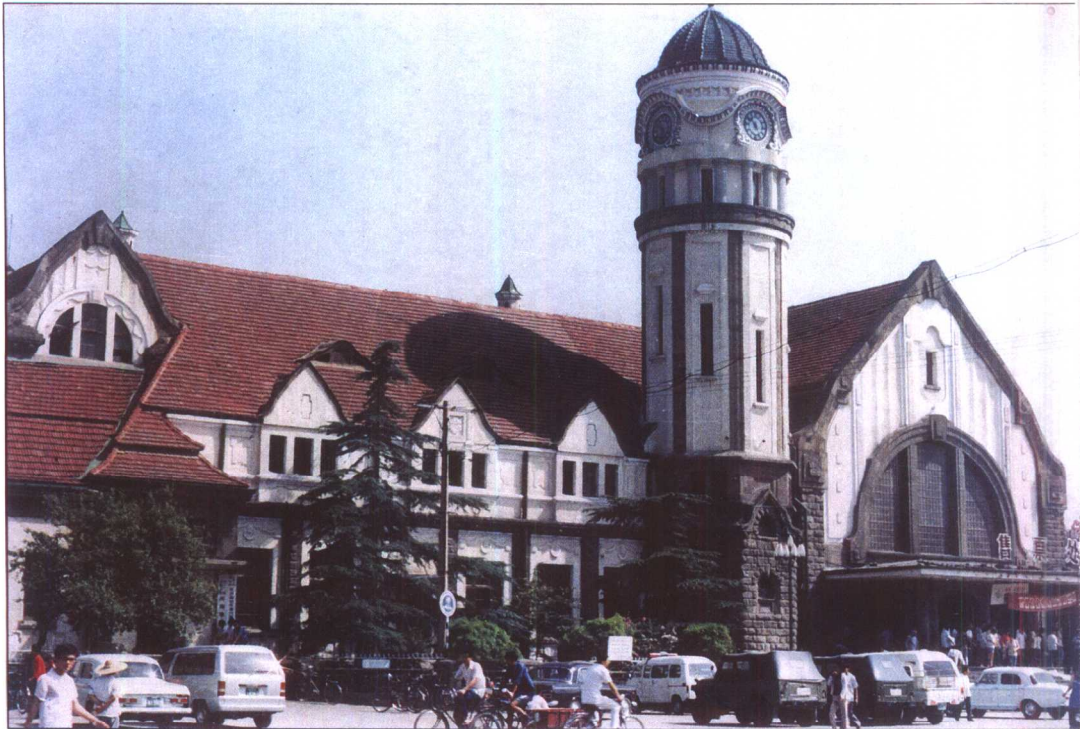
原津浦铁路济南车站