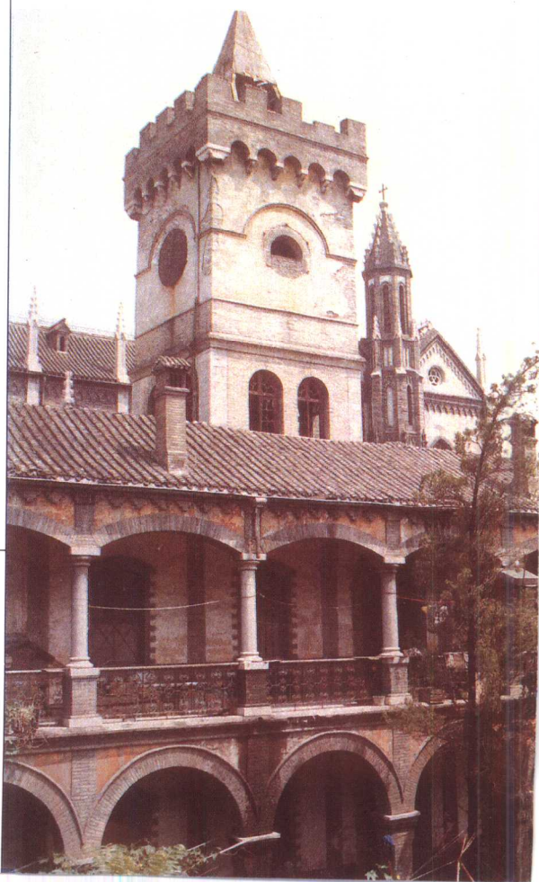
原天主教华北总修(道)院和钟楼