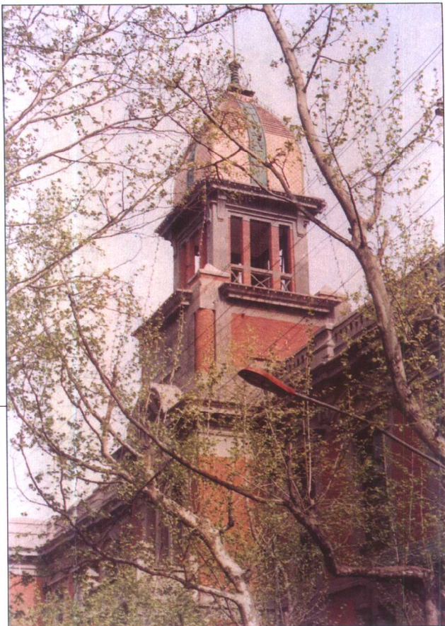
基督教自立会礼拜堂