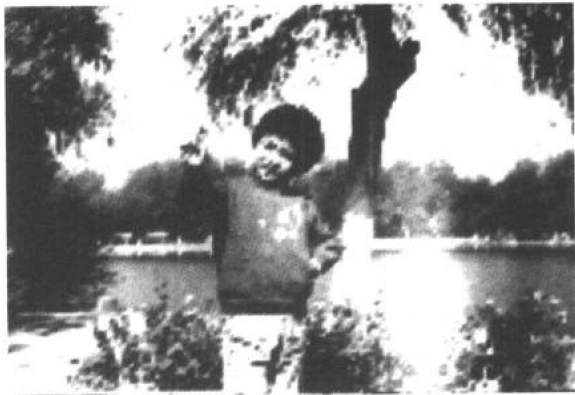
小小年纪，莫不是要指点江山？