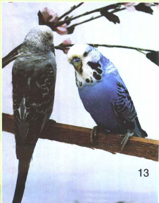
蓝和灰色虎皮鹦鹉