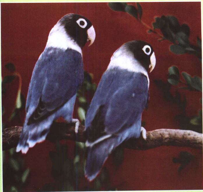
蓝黑头（普 蓝）牡丹鹦鹉