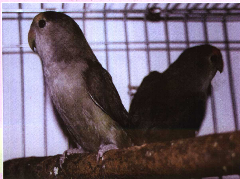
墨绿桃脸牡丹鹦鹉（俗称坦克绿）