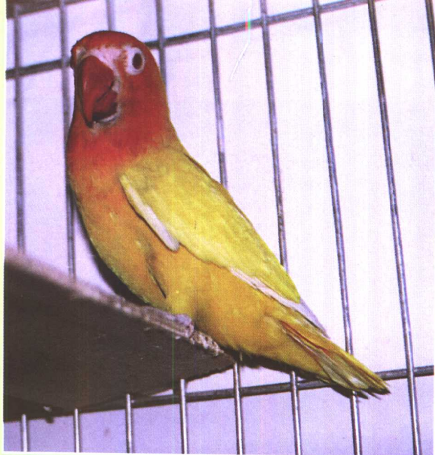
金丝桃脸牡丹鹦鹉