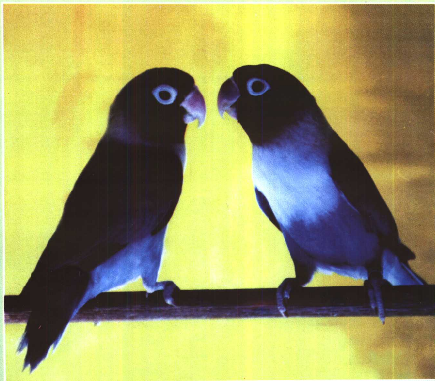
墨水蓝黑头牡丹鹦鹉