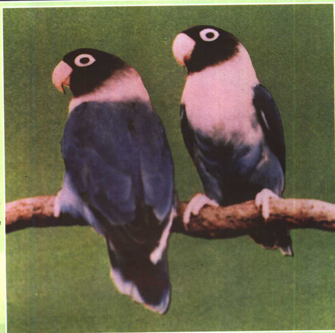
蓝黑头（普 蓝）牡丹鹦鹉