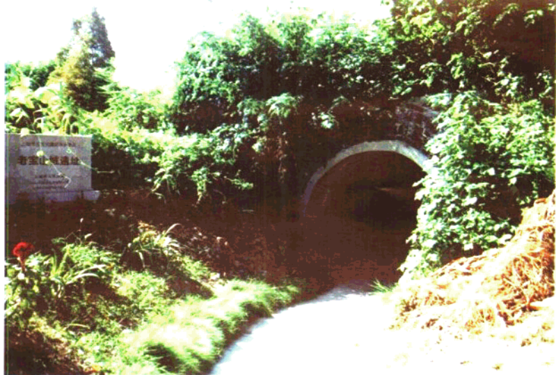
清代老宝山城遗址