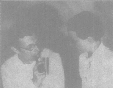
二战后，萨特与波夫瓦