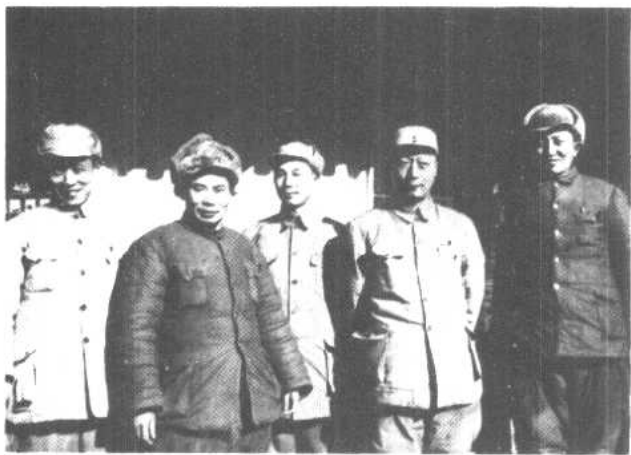
一九四九年一月，在平津战役前线总部。 左起：李天焕、杨得志、杨成武、聂荣臻、罗瑞卿。