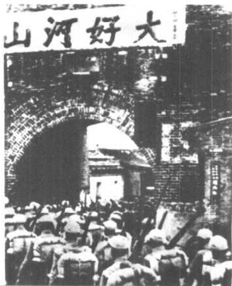
张家口战役胜利后，我军进入张家口市區。