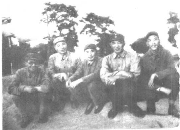
晋察冀野战军领导同志在冀中。左起：潘 自力、杨成武、杨得志、 罗瑞卿、耿飚。