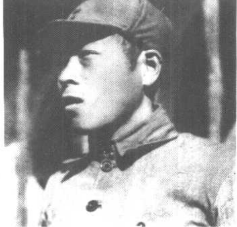
华北军区第三兵团 政委李井泉在包头。