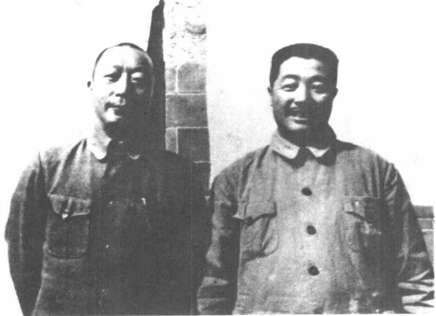
晋绥军区司令员贺龙(右)和华北军区司令员聂荣臻(左)合影。