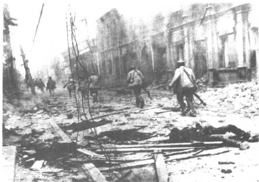
解放石家庄战役时，我军在市内追歼逃敌。