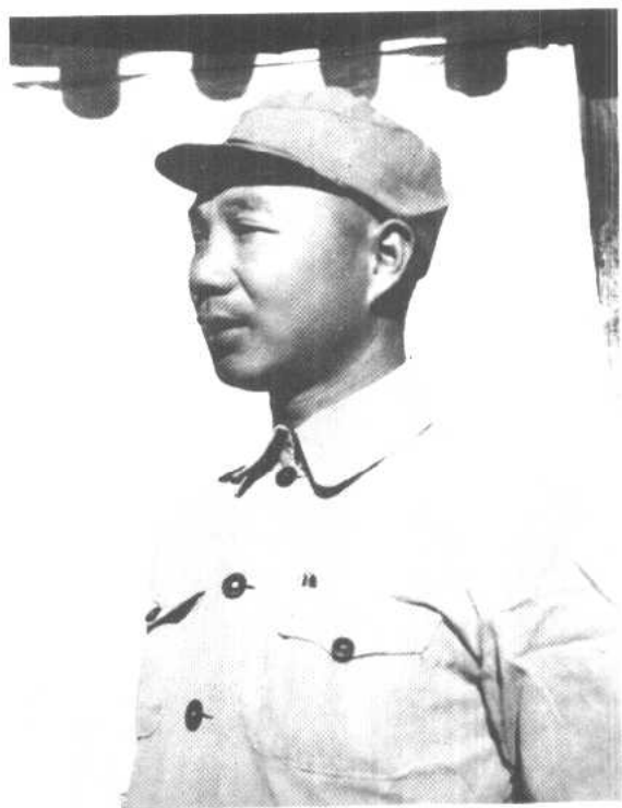
华北军区第三兵团司令员杨成武在包头。