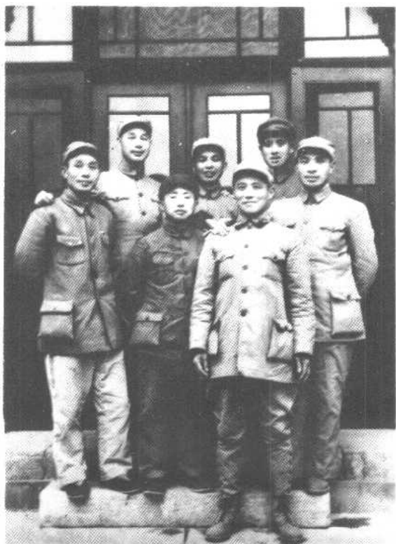
杨成武(左二)等领导同志在太原合影。