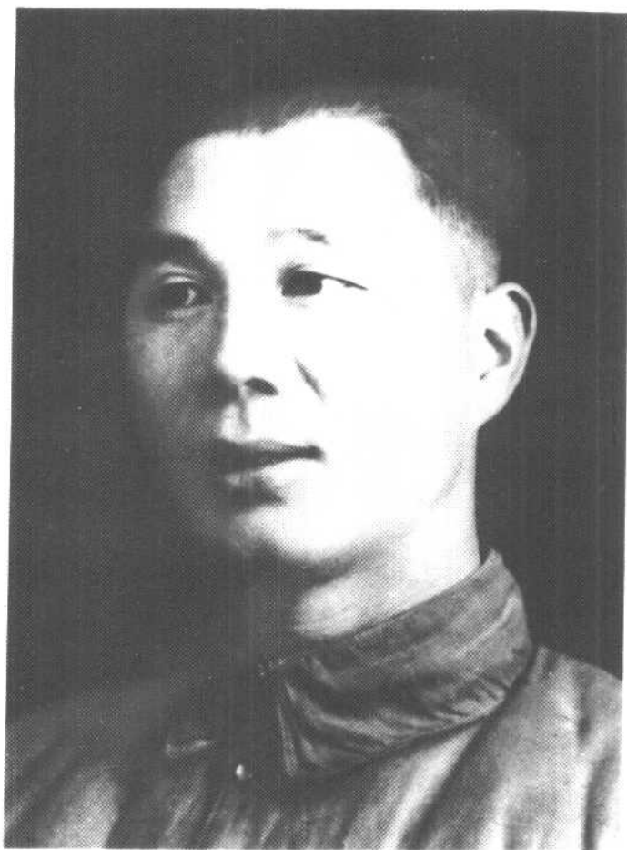
解放战争初期，晋察冀第三纵队 司令员杨成武在张家口。