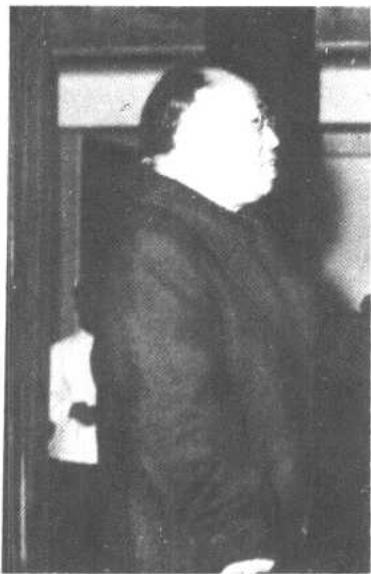
平津战役胜利后，东北野战军政委罗荣桓在北平。