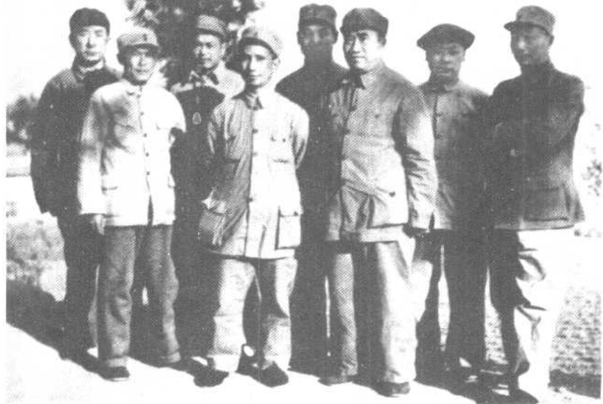
一九四八年五月，朱德和华北军区、中原军区领导同志合影。 左起：薄一波、蔡树藩、李先念、粟裕、彭真、朱德、陈毅、聂荣臻。