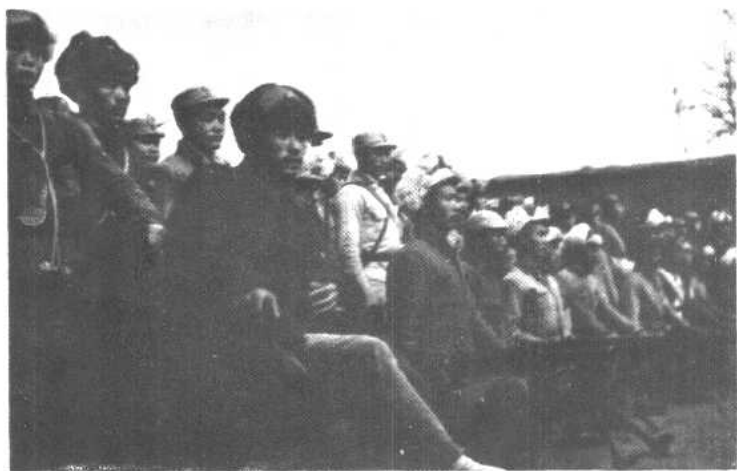
晋察冀三纵队钢铁营的英雄们。