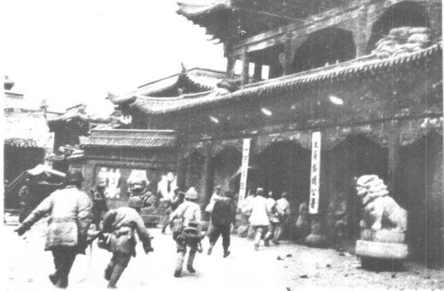
我军攻入太原市内。