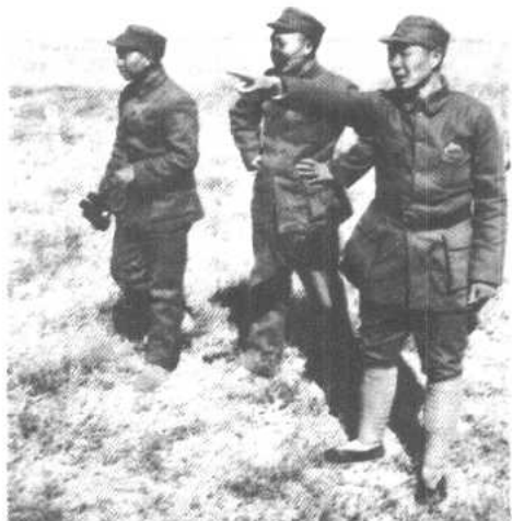
正太战役时，聂荣臻（中）、萧克（左）、 杨成武（右）在前线指挥作战。