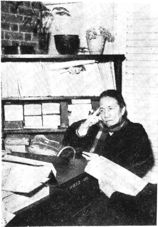
照時書本作寫在者作