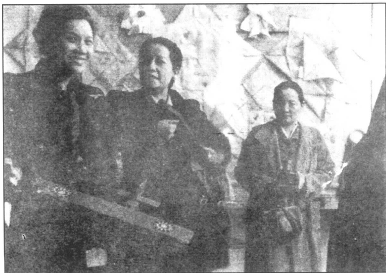
宋蔼龄（中）、宋庆龄（右）和宋美龄（左）在重庆参加抗日献机报国活动。