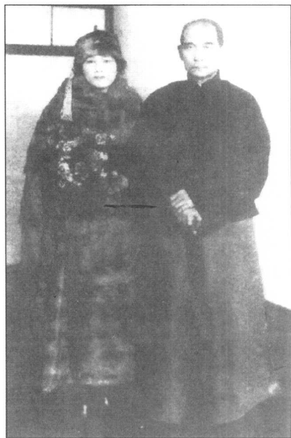
1924年，孙中山与宋庆龄乘“上海丸”轮船取道日本转赴天津。