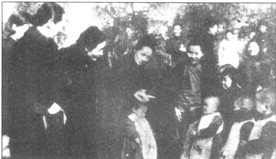
1938年末，宋氏姐妹在重庆抗战儿童福利院与孩子们交谈。