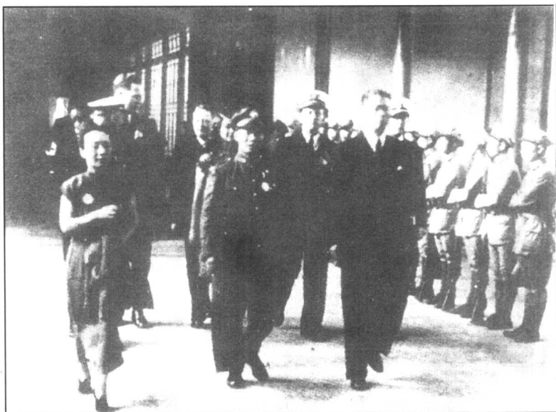
国民党行政院长宋子文与军政部长陈诚步入国民政府。