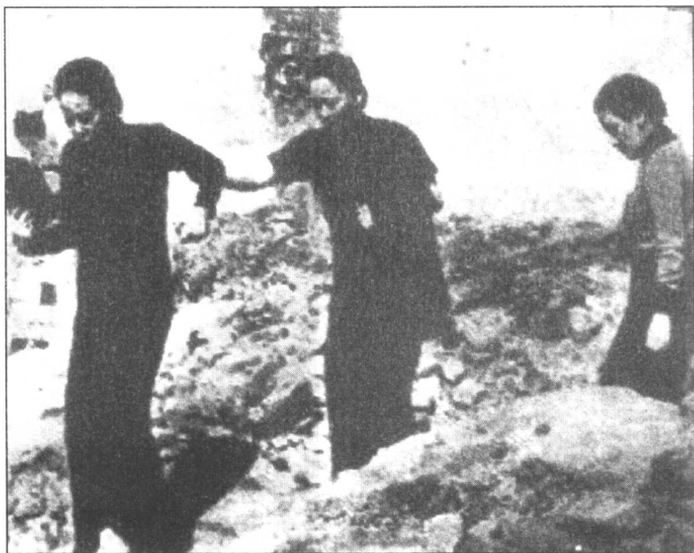
宋蔼龄、宋庆龄、宋美龄三姐妹视察被炸的重庆市区。