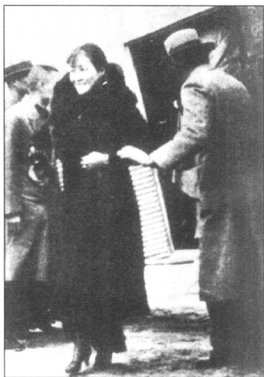
1936年，宋美龄飞抵西安