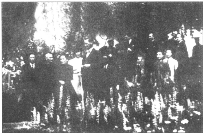
蒋介石，宋美龄访问印度。