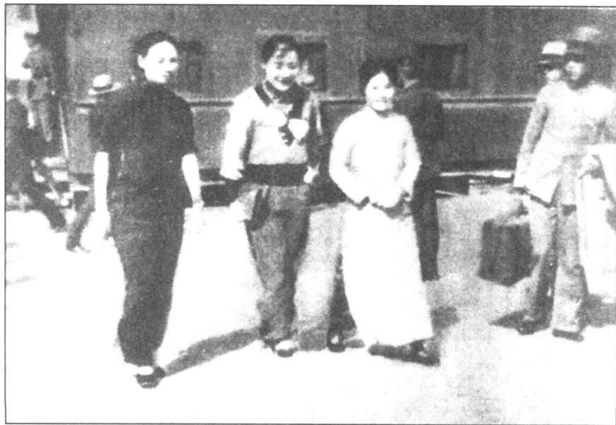
1934年10月12日，谢葆真（左一，杨虎城夫人）傅学文（右一 邵力子夫人）在陕西渭南车站迎接宋美龄（中）。