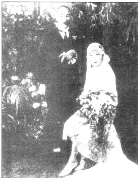
1927年12月1日，蒋介石与宋美龄在上海按基督教礼仪结婚。