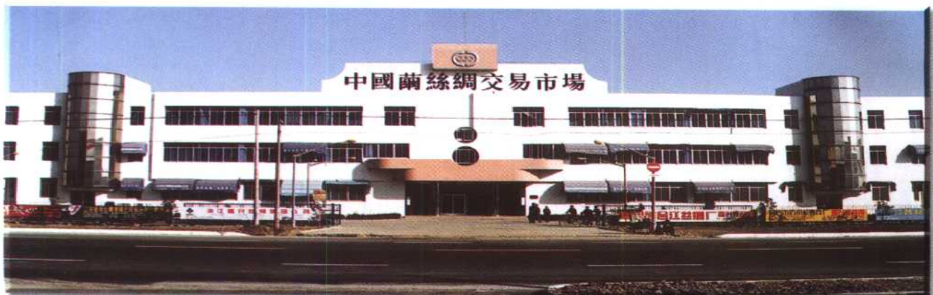
中国茧丝绸交易市场