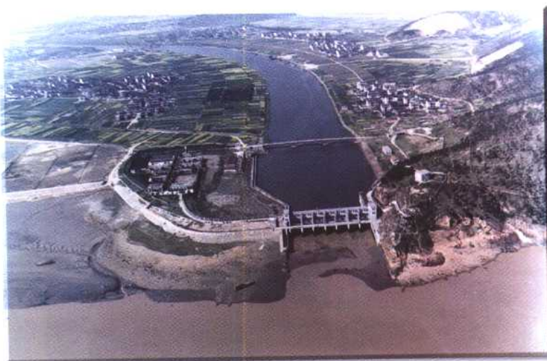
南排出海工程长山闸