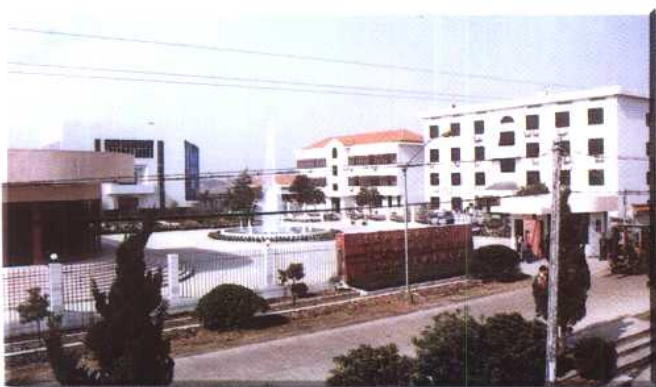
嘉兴中华化工总厂（乡镇企业）