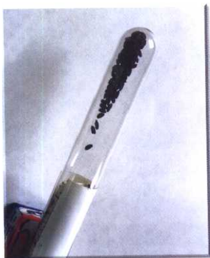
罗家角出土的距今七千年的 古代稻谷