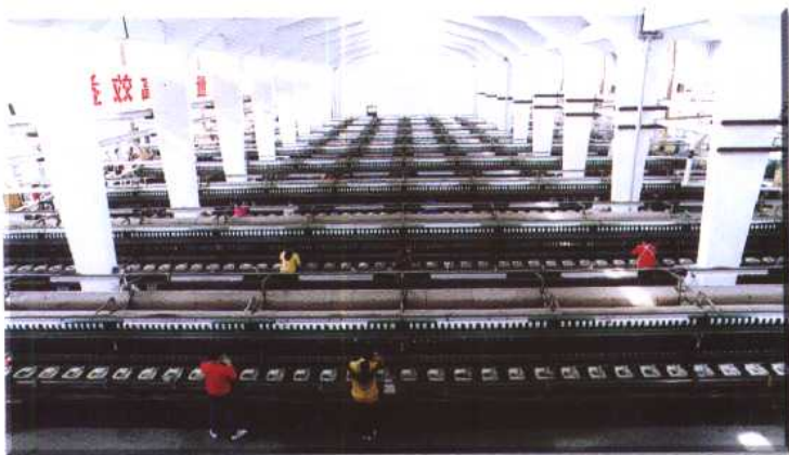
嘉兴制丝针织联合厂