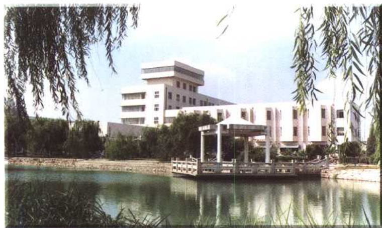
电子工业部第36研究所