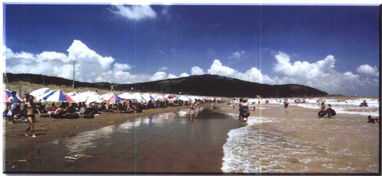
平湖 九龙山海滨浴场