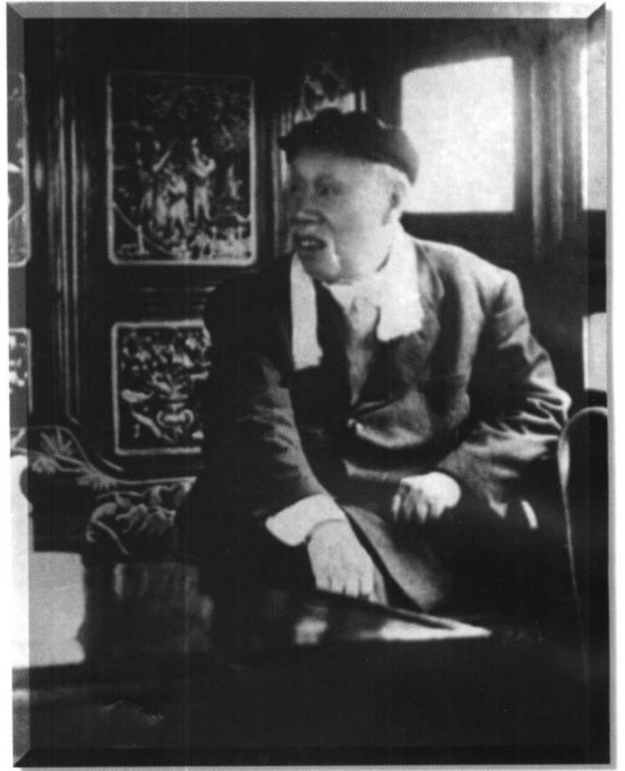
董必武 1964 年参观南湖革命纪念馆

革命聲傳各舫中 誕生共黨慶工農重來 正值清明節煙雨迷濛 訪舊蹤 董必武題 一九六四年四月