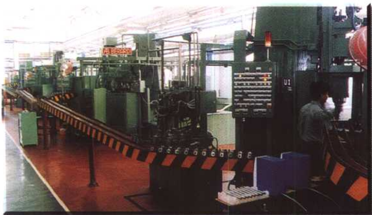
中外合资加西贝拉压缩机有限公司