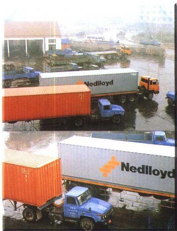
嘉兴国际集装箱运输中转站