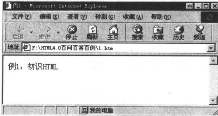
图 1.1 初识 HTML

编写完后，以.html 或.htm 为后缀名保存文件为 1.htm。双击打开该文件，网页显示效果如图 1.1 所示，其中文档标题将显示在浏览器上方标题栏的最左端。