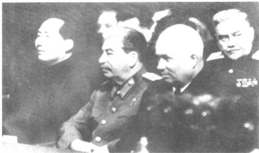
自左至右：毛泽东、斯大林、赫鲁晓夫、布而加宁在斯大林 70 寿辰庆祝会主席台。