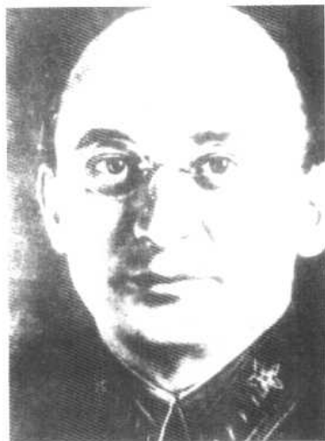
贝 利 亚