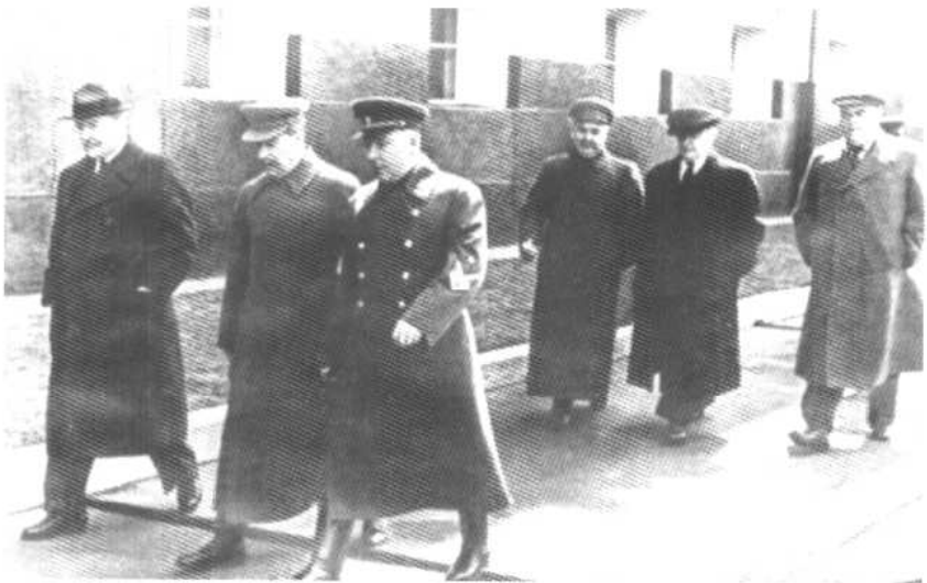
各怀心事的政治局委员们，莫洛托夫、斯大林、伏罗希洛夫、马林科夫、贝利亚、舍尔巴科夫(自左至右)