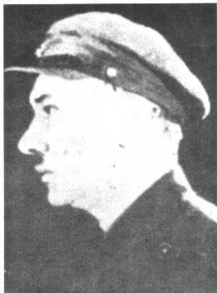
雅 戈 达