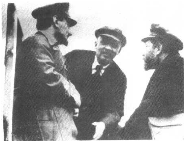
或许是战友间最后一次亲密交谈。托洛茨基、列宁和加米涅夫(自左至右)