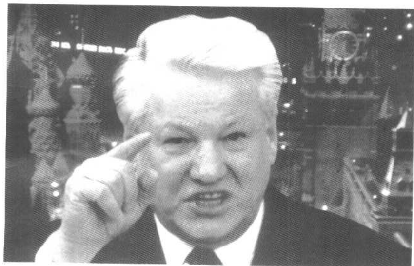
永不言败的叶利钦