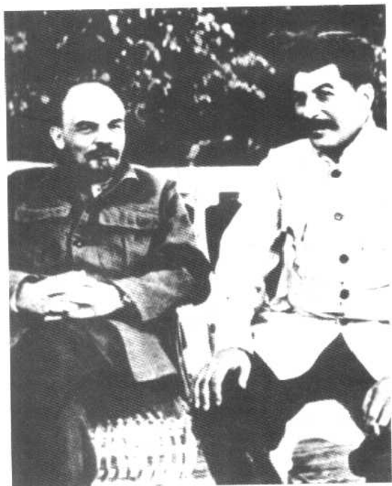
列宁和斯大林 于哥尔克(1922年)