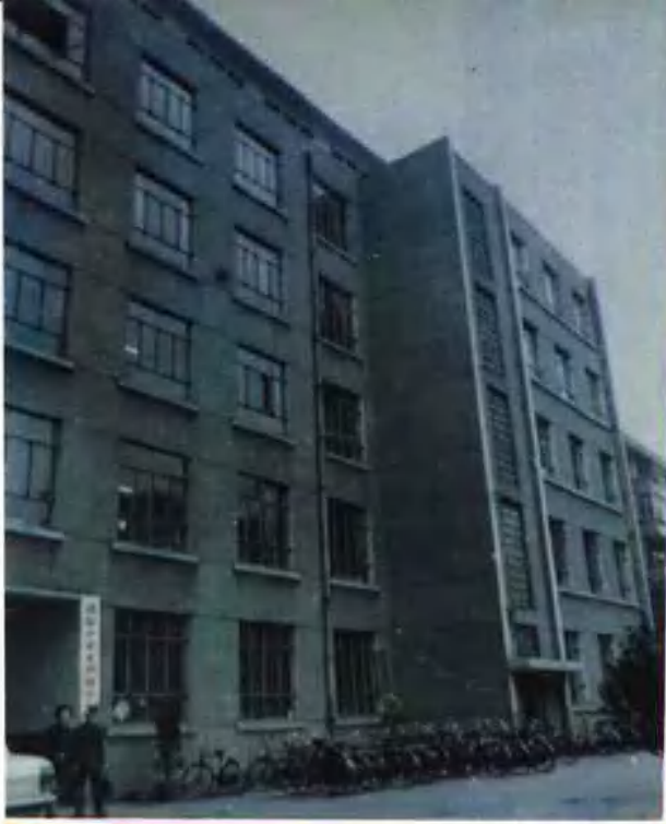
成都市就业训练中心教学大楼