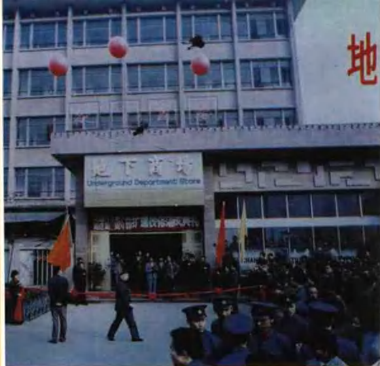
省、市主要领导在成都青年 地下商场视察指导工作