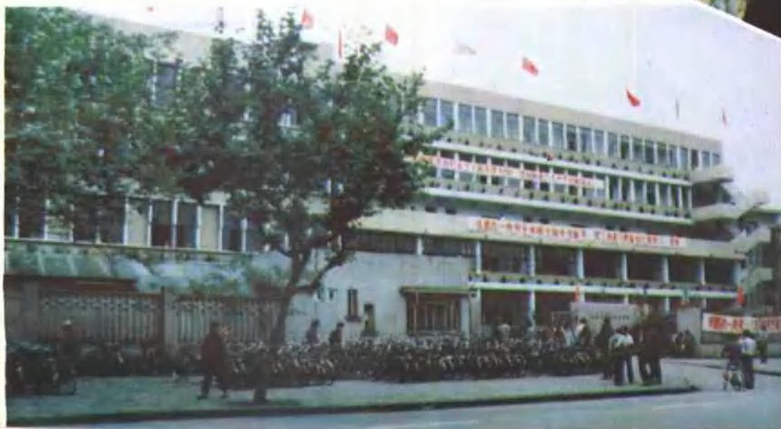
成都市第一技工学校外景