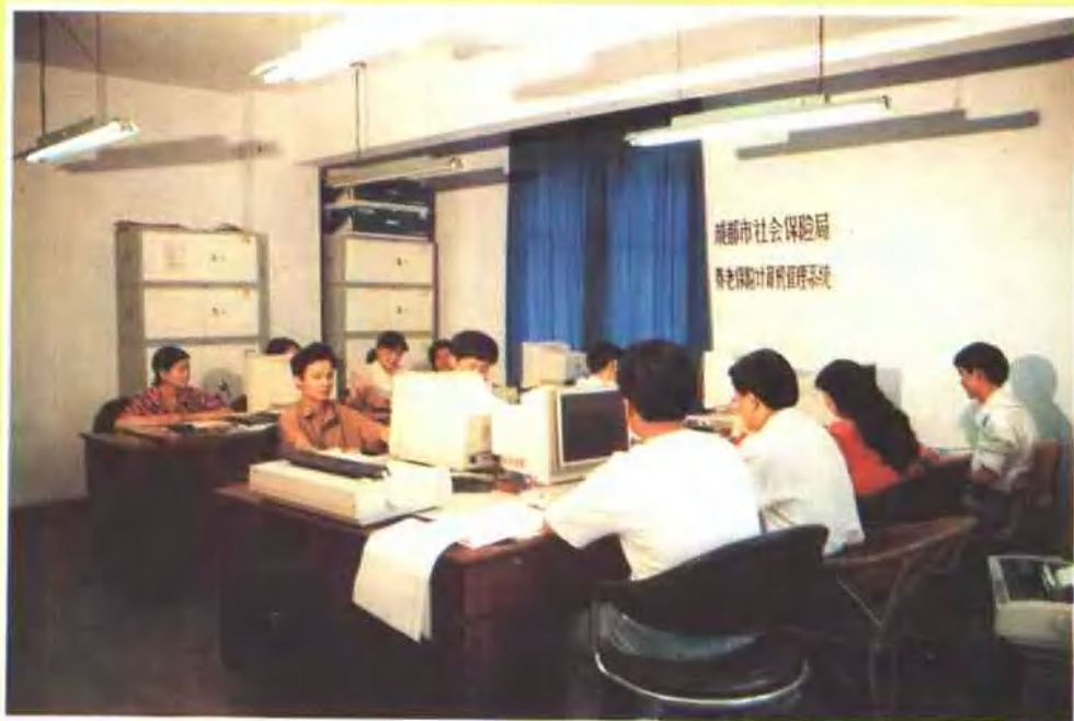
成都市企业职工养老保险实行计算机管理