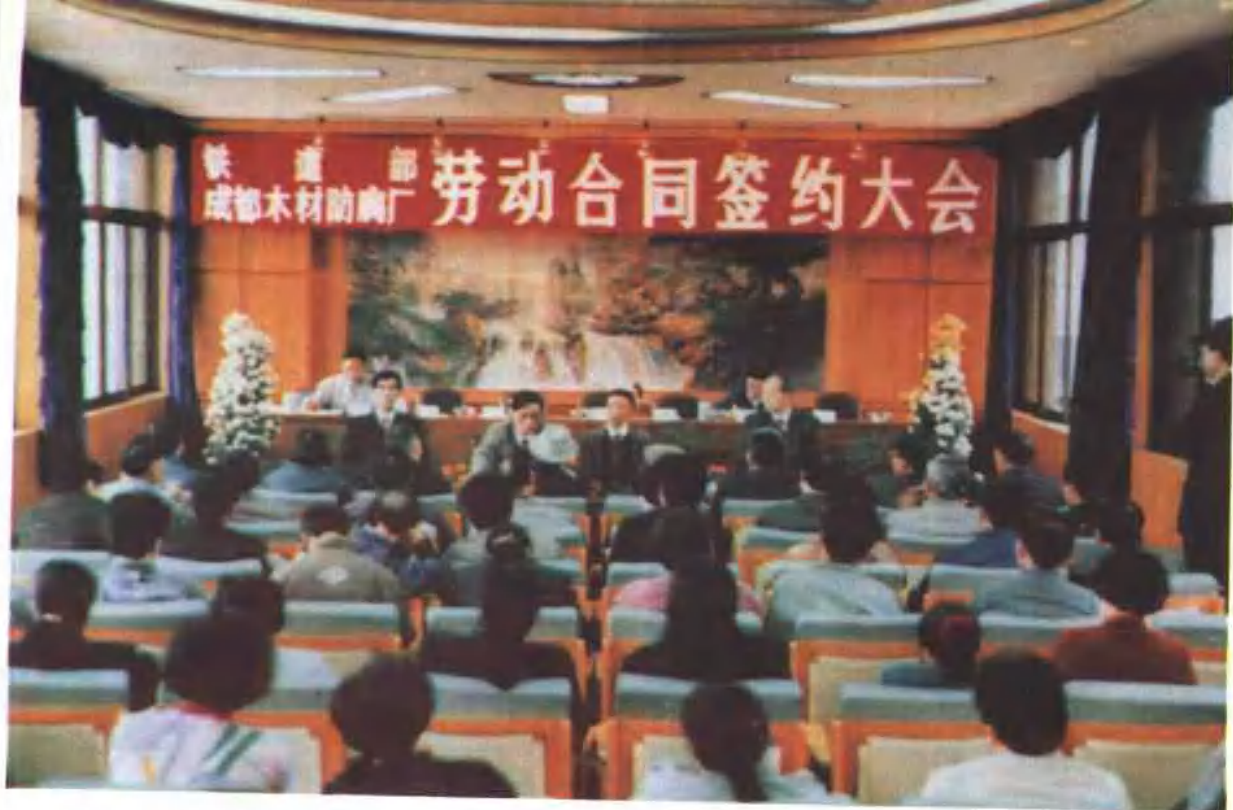
劳动制度改革不断深化,劳动合同制普遍推行