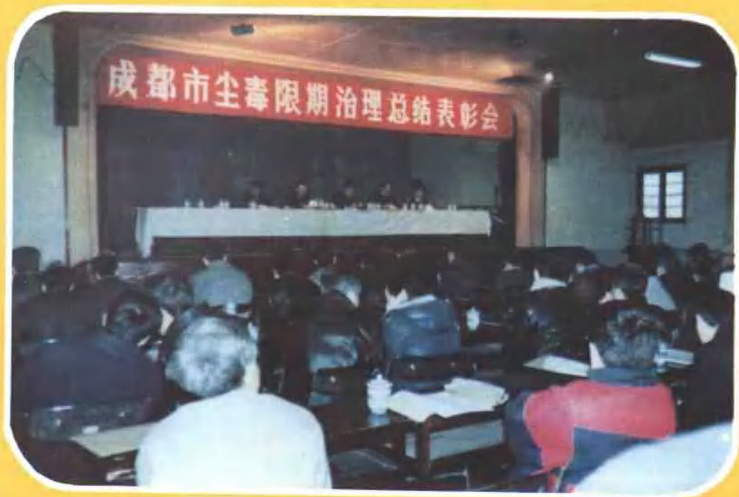
保护职工健康,治理尘毒危害