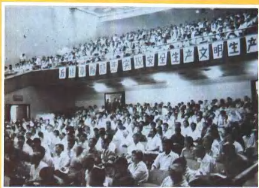
安全第一,预防为主,保护职工的安全和健康