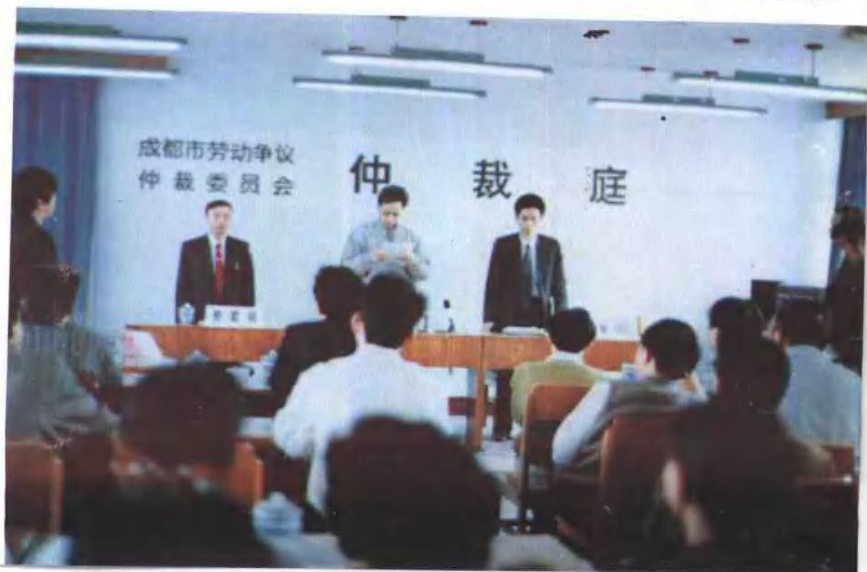
公正、依法维护企业和劳动者合法权益