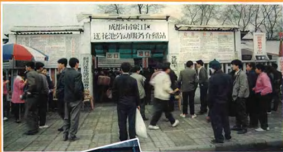
成都市锦江区莲花池劳务市场外景