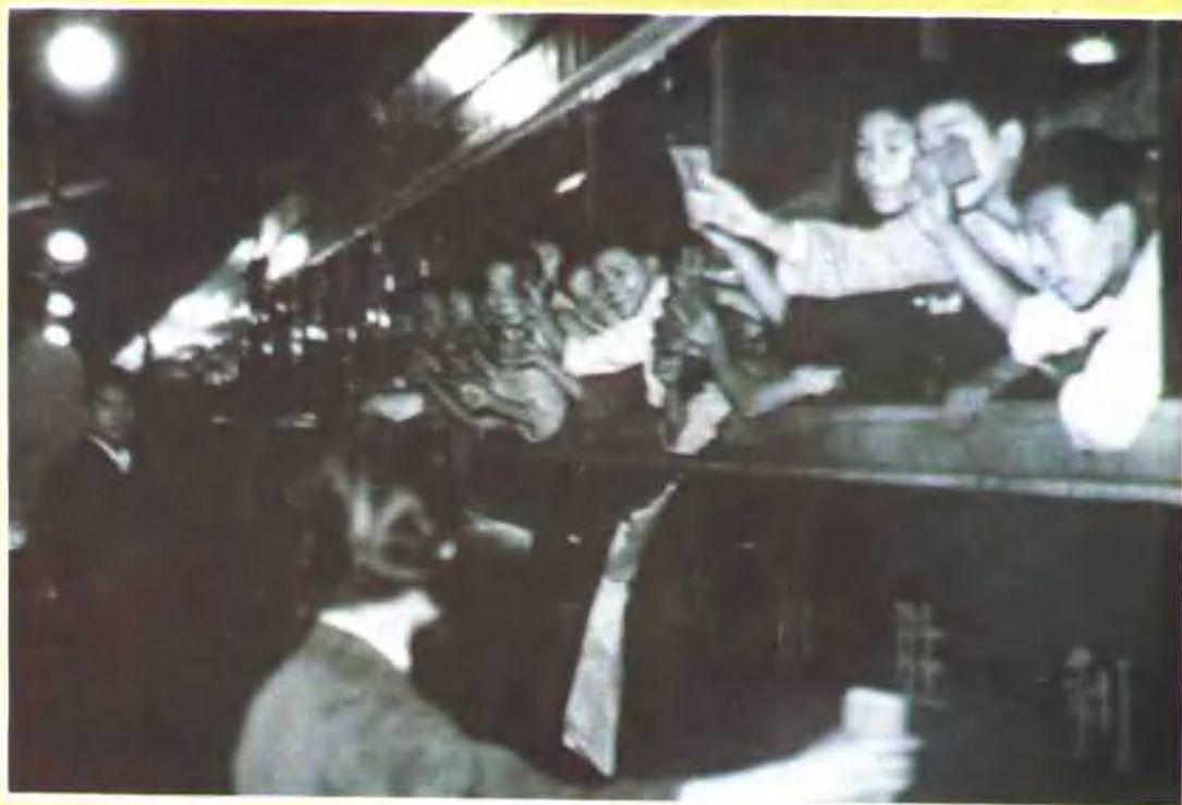
成都支边知识青年到达云南楚雄