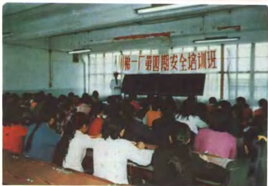
开展安全培训,减少伤亡事故