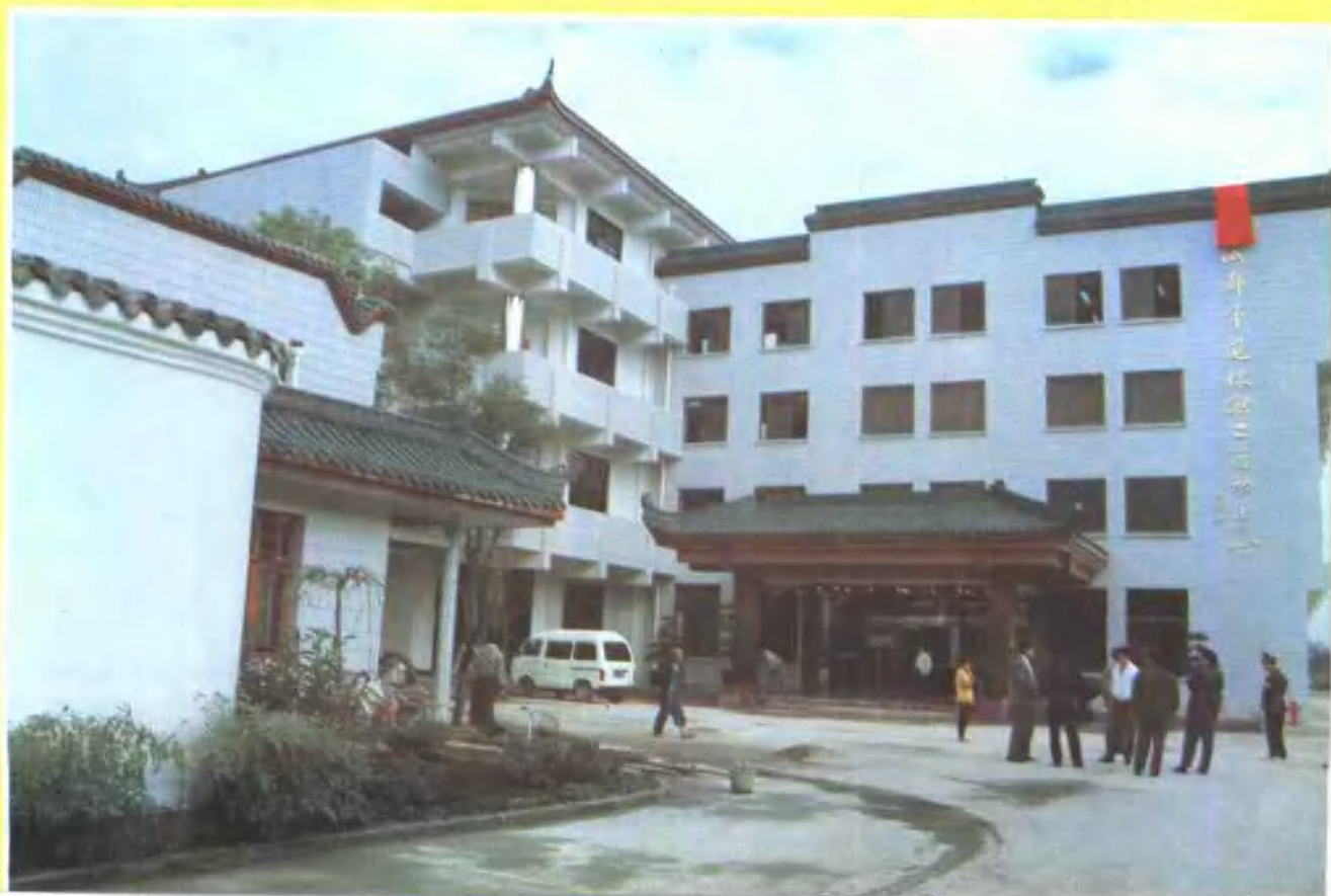
成都市退休职工活动中心