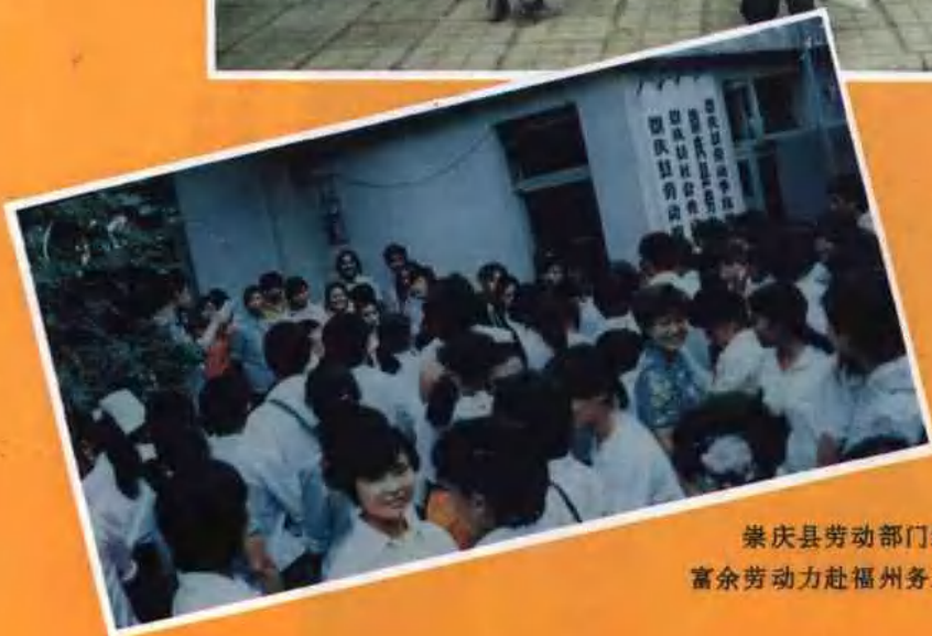
崇庆县劳动部门组织农村 富余劳动力赴福州务工，行将出发