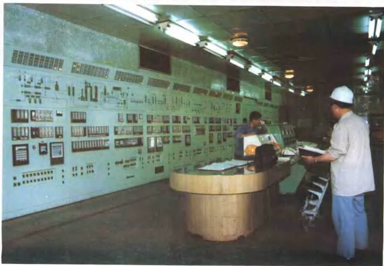
四川化工厂 20 万吨合成氨总控制室监控各类污染物的排放,减少事故的发生