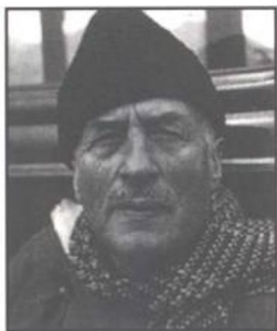
斯文·赫定 (Sven Hedin)

斯文·赫定，一八六五年出生于瑞典首都斯德哥尔摩一个中产阶级家庭，其父为知识分子，终生对斯