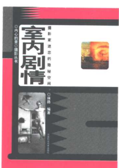
◎内心的景◎摄影丛书