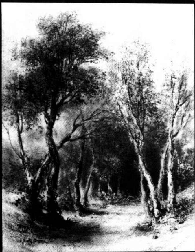
芒代·达盖尔《树林景观》(铅笔画)

苍凉的秋郊黄昏行旅图。马致远借自然风景叙说悲秋怀乡的情怀，不正是我们所要论述的内心的风景吗？