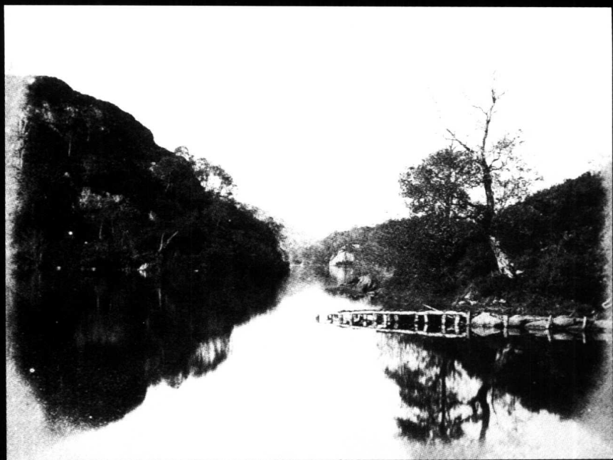
福克斯·塔尔博特《卡特林湖》(1844)