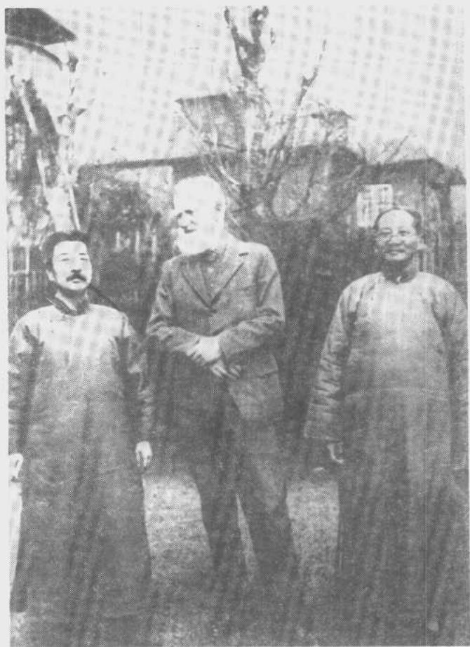
一九三三年与萧伯纳、蔡元培的合影