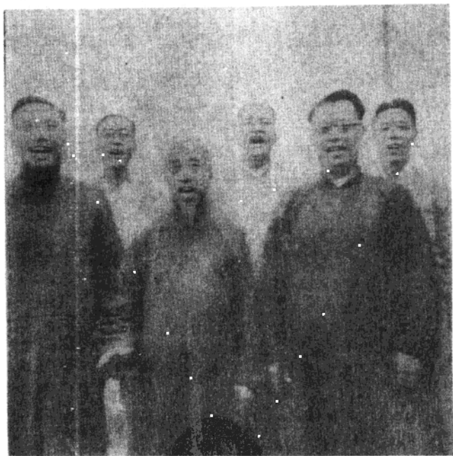
。曲歌的壯雄唱是，樂娛的們他