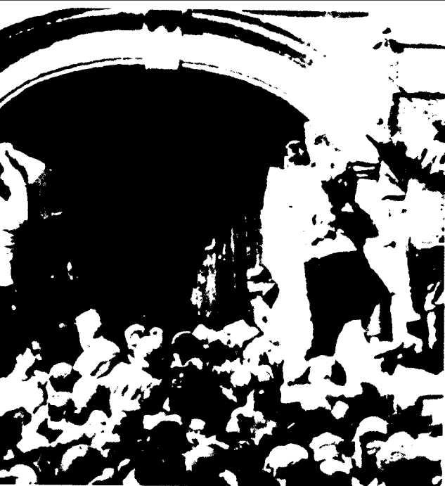
1927年1月3日，武汉民众冲击汉口英租界。参加抗议五卅惨案游行的大学生，衣服上书写着废除不平等条约等标语。