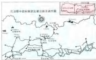
▲尼泊爾中部和東部主要公路及城市圖

從少年時代就一直嚮往印度、巴厘島、錫蘭、尼泊爾的佛教與印度教的遺跡和藝術，每從畫上看見圖片就神往不已。不過在二十年前，出國旅行的費用高得不敢想像，出國觀光旅行也尚未開放，想要到那些嚮往的土地上徜徉，根本是一種夢想。如今，情勢轉移，出國旅行已經成為台灣人度假的普