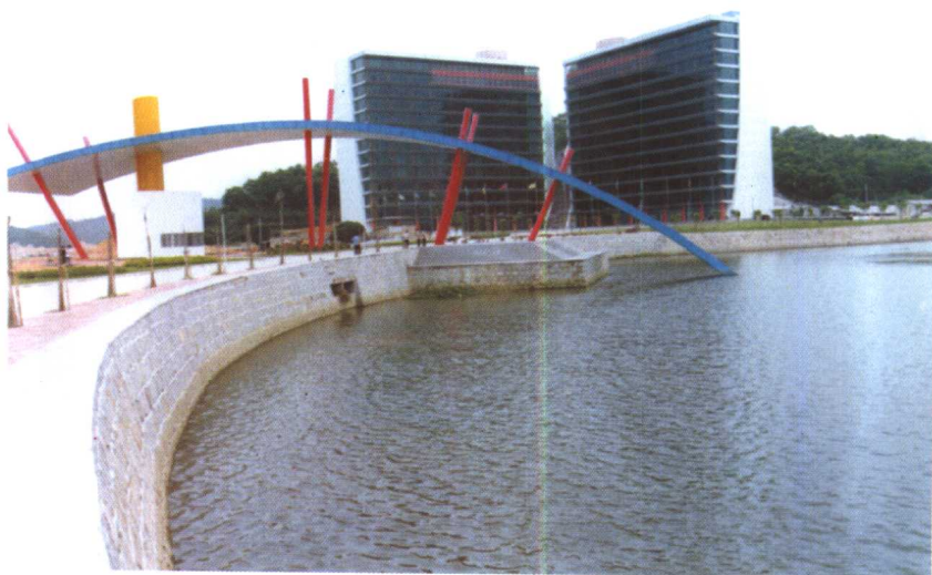
中山大学珠海校区图书馆