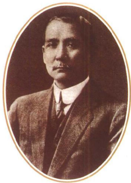
中山大學創辦人孫中山先生