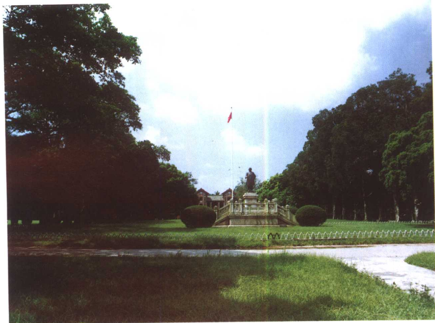
中山大學廣州校區中心區一景